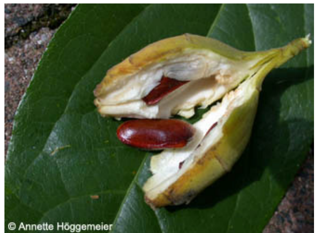
geöffnete Frucht mit Samen

Während die Winterblüte bei uns nur als Zierstrauch gepflanzt wird, findet sie in China auch weitergehende Verwendung. So werden die Knospen in der chinesischen Medizin gegen Husten, Schwindel, Übelkeit, Kopfschmerzen und Hitzewellen verwendet, die Wurzeln gegen Grippe, Rheuma und Asthma sowie zum Blutstillen. In der chinesischen Küche benutzt man die Blüten wegen ihres Duftes z. B. bei der Zubereitung von Fisch, Tofu und Suppe.