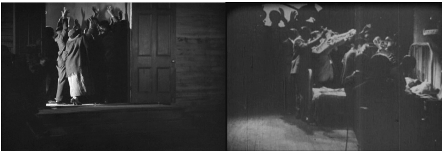
HALLELUJAH (USA 1929), (1:17:41) | BLACK AND TAN FANTASY (0:15:23)

Auch dieser Film endet, wie schon ST. LOUIS BLUES , tragisch, und gerade nicht mit dem der vaudeville-/musical -Tradition eingeschriebenen happy end . 18 In der Sterbeszene sind Sänger und Musiker zu sehen, die ihre hoch in die Luft erhobenen Arme und Instrumente schwenken. Das scheint kein Zufall, bedenkt man, dass das bis heute fortlebende Instrumente-Schwenken-Klischee von Anfang an eine wichtige Strategie war, ‚Jazz‘ filmisch umzusetzen: Schon über den ersten Filmauftritt einer Jazzband überhaupt in dem Film THE GOOD-FOR-NOTHING (1917) berichtet Nick LaRocca von der Original Dixieland Jazz Band , dass die Band „in einer kurzen Nachtclub-Sequenz aufzustehen und mit ihren Instrumenten hin- und herzuschwenken [hatte], während der Pianist sitzenblieb“ (Dauer 1980, 42). Zudem greift, wie die folgende Abbildung zeigt, Murphys Sterbeszene direkt auf visuelle Mittel der Kernszene von Vidors HALLELUJAH! zurück, wo Zeke als flammender Prediger gegen den Teufel kämpft, von dem „gamblers“, „corn-whiskey drinkers“ und „jazz dancers“ besessen seien. Chick betritt den Saal und wird von Zekes Rede ergriffen. Als die Gemeinde singt „We done be sanctified. We done be purified“ stimmt sie mit ein. Der Jubel gipfelt in dem Spiritual „I Belong to That Band, Hallelujah“. 19 Die zunehmende kollektive Ekstase wird durch zunehmendes Arme-Schwenken visualisiert, das schließlich durch Schattenwurf inszenatorisch zusätzlich vergrößert wird: