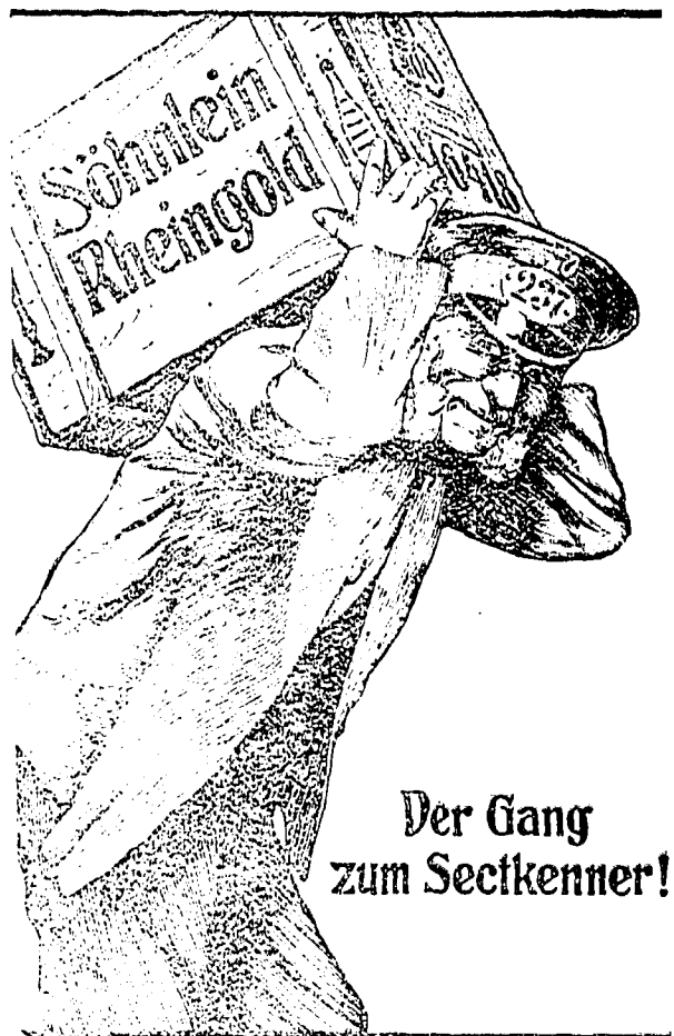
Der Gang zum Seckener!

Für Deutsch-Ostafrika ist der Generalvertrieb der weltbekannten Champagnermarken: „Söhnlein Rheingold“ Grosser Preis St. Louis 1904 „Söhnlein Rymannshäuser“ (Roter Sect) an ein erstes Haus zu vergeben.