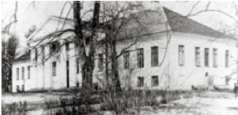
Das Gutshaus Rayküll in Estland übernahm Alexander Keyserling 1847 nach seiner Heirat mit Seneide Cancrin, der Tochter des russischen Finanzministers. Ihr Enkel Hermann verbrachte hier Kindheit und Jugend. 1918, mit der Landreform der jungen estnischen Republik, wurde das dazugehörige Gut zum größten Teil enteignet. Dieses Foto entstand nach dem Zweiten Weltkrieg.