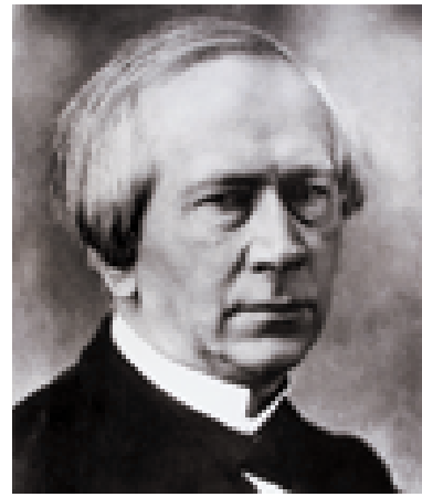
Alexander Keyserling, der Naturforscher, aus dem lettischen Kurland stammend, war in St. Petersburg in Diensten des Zaren, schließlich Gutsherr in Estland sowie Hauptmann der dortigen Ritterschaft und Kurator der Dorpater Universität, die unter seiner Aufsicht wissenschaftliche Bedeutung erlangte.

(süd)amerikanischem Weltgefühl, war zu Lebzeiten so umstritten, wie er heute vergessen zu sein scheint – eine widersprüchliche, vielseitig begabte Gestalt, reich an Einfällen und Einsichten. Man hat ihn verschwenderisch genannt, und es passt dazu, dass er den Verlust der Heimat 1918 klaglos zu tragen wusste – und wegen seines Verständnisses für die Haltung der jungen estnischen Republik zu manchen des Umdenkens unfähigen Lands- und Standesgenossen in Widerspruch geriet. Die Tagung in Tartu erhält, so gesehen, etwas von einer geistigen Wiedereinbürgerung, über die sich der hei-