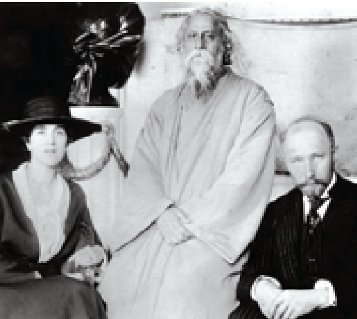
Hermann Keyserling, der Leiter der »Schule der Weisheit«, Ende der 1920er Jahre in seinem Darmstädter Arbeitszimmer.