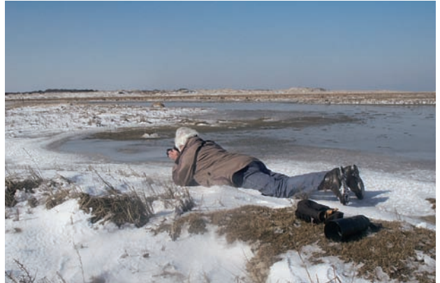
Abb. 11: So sieht Leidenschaft aus: trotz Eis und Schnee auf Spiekeroog den Kleinvögeln auf der Spur. Jan. 2003.

HHB kann aber nicht nur auf viele erfolgreiche und erfüllende Jahre als Forscher zurückblicken, sondern war und ist auch und gerne als Lehrer äußerst rührig und erfolgreich. So hat er ein Heer junger Leute während ihres Studiums motiviert und die Arbeiten zahlreicher Staatsexamenskandidaten, Diplomanden und Doktoranden mit großem Engagement betreut. Allein bei den Doktoranden liegt die Zahl bei über 20! Wer immer