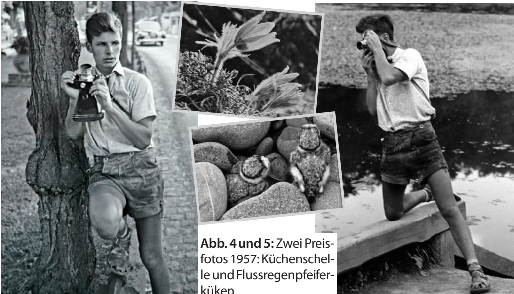
Abb. 4 und 5: Zwei Preisfotos 1957: Küchenschelle und Flussregenpfeiferküken.