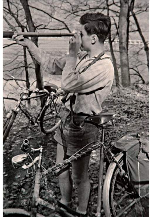
Abb. 6: Vor mehr als 50 Jahren: mit Drahtesel und Fernrohr den Gefiederten auf der Spur. Edersee ca. 1956.