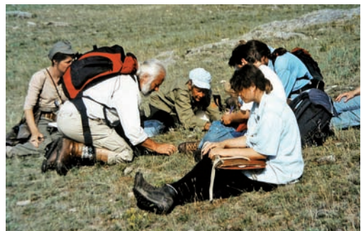
Abb. 9: HHB im Pribaikalsky Nationalpark den Pflanzen auf der Spur. Juli 1999.

Es ist unmöglich, im Rahmen dieser schriftlichen Laudatio alle wissenschaftlichen Leistungen von HHB darzulegen. Den besten Eindruck erhält man durch die Liste seiner Publikationen, die zahlreiche Bücher sowie Arbeiten in fachwissenschaftlichen und populärwissenschaftlichen Zeitschriften und