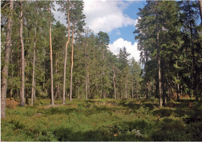
Abb. 4: Winternutzungszentrum an einer breiten Schneise.

stimmte Bäume auf Grund ihres Standortes, ihrer Kronenform, der umgebenden Waldstruktur und der chemischen Zusammensetzung der Nadeln besonders bevorzugt werden. Die umgesiedelten Auerhühner fanden die traditionellen Nutzungszentren schon einige Wochen nach der Auswilderung. Sie suchten nach der Freilassung den neuen Lebensraum z. T. recht großflächig ab. Bei diesen Ausflügen entdeckten sie sehr schnell die geeigneten Strukturen und Baumqualitäten in den Wirtschaftswäldern.