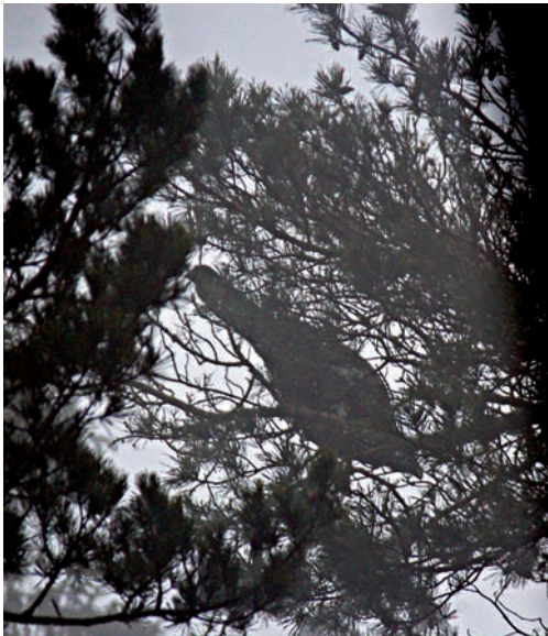
Abb. 3: Auerhahn auf einer Kiefer in einem der vier untersuchten Winternutzungszentren.

gruppen wurden ausgewählt und jeweils im Winterhalbjahr 2001/02 bis 2004/05 systematisch untersucht. Um herauszufinden, ob es Bevorzugungen einzelner Bäume gibt, wurden jeden Winter die genutzten Bäume mit Farbbändern markiert. So konnte die Wiedernutzungsrate ermittelt werden. Die Winternutzungszentren sind durch die unter den Bäumen in großen Mengen vorhandene Lösung gut zu finden. Oft verbringen die Vögel viele Tage auf einem bevorzugten Baum (Abb. 3).