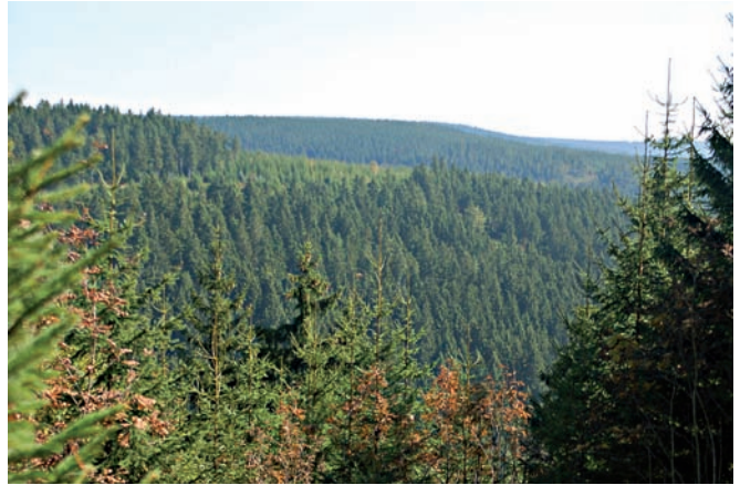
Abb. 2: Typische Landschaft im Thüringer Schiefergebirge.

erschlag nimmt von Norden mit 800 mm nach Süden auf 1000 bis 1200 mm zu. In den höchsten Lagen des Untersuchungsgebietes, um Neuhaus und Steinheid, fallen bis 1400 mm Niederschlag im Jahr (Hiekel et al. 2004). Die Jahresdurchschnittstemperatur beträgt im gesamten Gebiet 5 bis 6°C, das Januarmittel -3°C und das Julimittel 14–15°C. Die höchsten Niederschlagsraten werden in den Monaten Oktober bis Februar registriert.