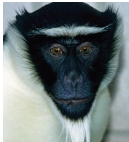
Die Diana-Meerkatze gehört zu den bedrohten Tieren – noch trägt sie bei zur außergewöhnlichen Artenvielfalt im Tanoé-Sumpfwald

Denken Sie manchmal: Mit meiner Stimme oder Unterschrift kann ich ja doch nicht die Welt retten? Zwanzigtausend Menschen rund um den Erdball haben vielleicht genauso gedacht – und konnten doch gemeinsam mit ihren Protest-Mails einen Konzern in die Knie zwingen. Der Erfolg rettet zwar nicht die Welt, aber ein kleines, einzigartiges Stück der Erde: den Tanoé Sumpfwald im westafrikanischen Staat Elfenbeinküste. „Wir haben beschlossen, unser Palmöl-Projekt in diesem Gebiet aufzugeben“, verkündete Ende April die Firma PALMCI, größter Palmölproduzent des Landes. Nicht, ohne hinzuzufügen: „Das ist eine Schande für die Region. Aber einige Nichtregierungsorganisationen wollen nicht akzeptieren, dass Umweltschutz und wirtschaftliche Entwicklung nebeneinander existieren können. Ihr Kampf gegen dieses Projekt macht das Ganze für uns zu kompliziert.“ Was PALMCI-Sprecher Franck Eba nicht erwähnte: Der Umweltschutz war das Letzte, woran der Konzern bei seinen Expansionsgelüsten gedacht hatte. Was war geschehen? Im Februar 2008 hatten PALMCIs Bulldozer damit begonnen, täglich 20 Hektar Urwald plattzuwalzen. Ihr Ziel war die vollständige Vernichtung dieses einzigartigen Sumpfwaldes – man brauchte Platz für Ölpalm-Monokulturen.