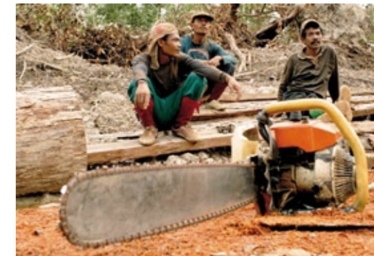
Die Abholzung für Pelikans Pinsel soll nun eingestellt werden

ziehen deshalb klare Konsequenzen. [...] Pelikan wird zukünftig weder Ramin Holz noch jegliche andere Art von geschützten Tropenhölzern zu Pinseln verarbeiten“. Tropenholz aus dubioser Herkunft begegnet einem auf Schritt und Tritt, egal ob in Fenster, Tür, Parkett, Möbel oder Bilderrahmen. Rettet den Regenwald macht deshalb gegen die gesetzwidrigen Machenschaften der Holzmafia mobil. Letztere betreibt mit der Plünderung der Regenwälder Milliarden-Geschäfte und profitiert dabei von der Untätigkeit von Bundesregierung und Europäischer Union (EU). Denn der Import, Handel und Verkauf illegalen Holzes ist bei uns immer noch nicht verboten. 31.000 Unterschriften hat der Verein gegen den illegalen Holzhandel gesammelt, die Hälfte davon wurde bei zwei Protestaktionen direkt an Bundesregierung und EU versandt. Ende April hat das EU-Parlament endlich reagiert und eine strenge Gesetzesvorlage auf den Weg gebracht. Als nächstes entscheiden EU-Ministerrat und EU-Kommission über das geplante