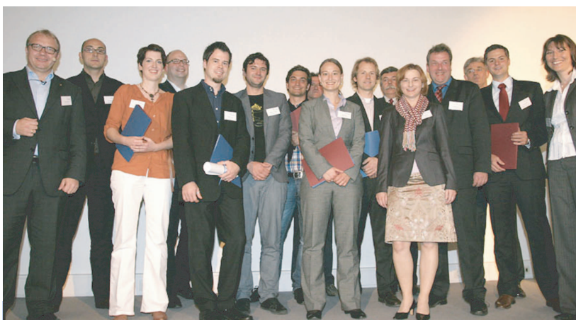
Der Goethe-Unibator hat zwei ausgezeichnete Unternehmen hervorgebracht.

gorie Printmedien, den besten Internet-Auftritt bot Musicfox aus Bruchköbel. Coneda bietet ein professionelles Datenbanksystem für die Archivierung, Verwaltung und Recherche von Bild- und Metadaten. Die gut gewählte Typographie und das hochwertige Design der Präsentationsunterlagen überzeugte die MediaAward-Jury. Musicfox ist ein Onlinestore für GEMA-freie Musik zur Vertonung von Imagefilmen, Werbespots oder Computerspielen. Hier lobte die Jury die übersichtliche Struktur, die angebotenen Musterbeispiele sowie die genaue Suchfunktion der Seite. Der MediaAward wird seit 2002 alljährlich von HOCHSPRUNG verliehen, einer Initiative des Bayerischen Wissenschaftsministeriums zur Förderung hochschulnaher Unternehmen bis vier Jahre nach ihrer Existenzgründung. Die Sieger hatten sich gegen mehr als 50 Konkurrenten aus ganz Deutschland durchgesetzt. (dhi)