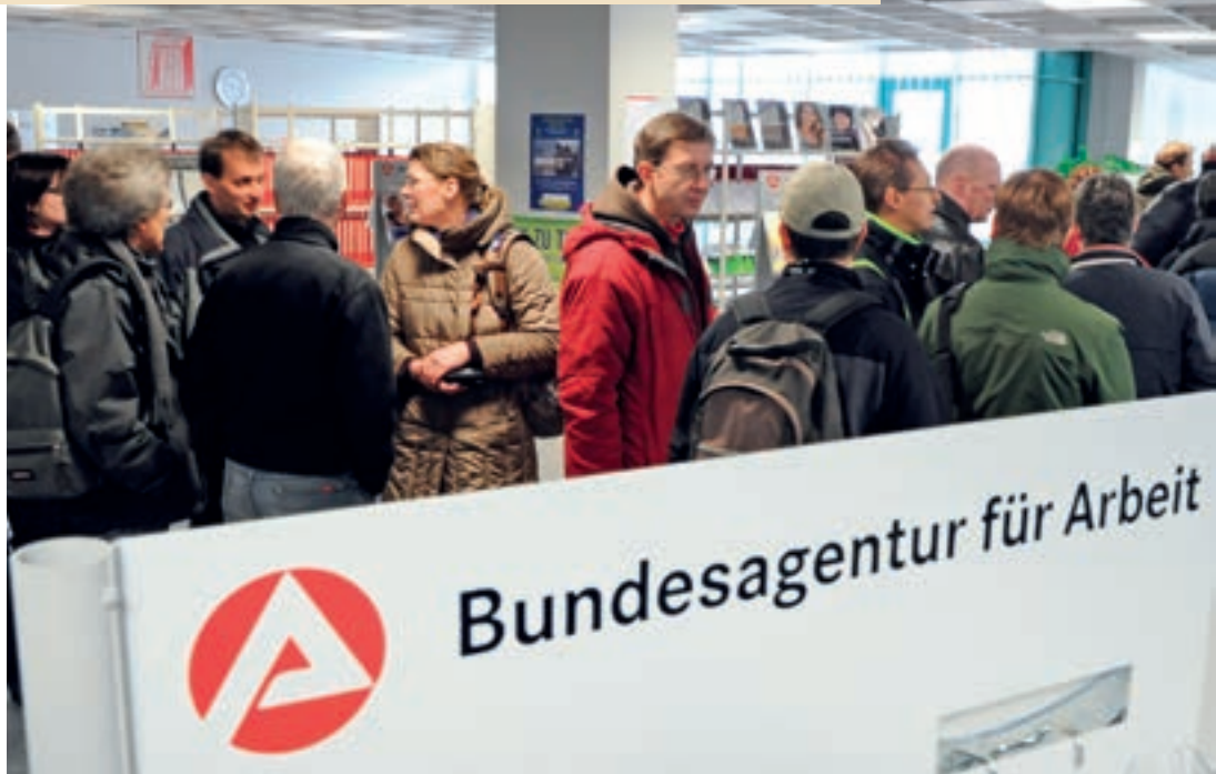
Die Bundesagentur für Arbeit war für viele Ostdeutsche nach dem Verlust ihres Arbeitsplatzes die erste Anlaufadresse.

Bei der Beantwortung der Frage, welche allgemeinen Schlussfolgerungen das Sparverhalten der Ostdeutschen nach der Wiedervereinigung zulässt, soll das Augenmerk auf dem Vergleich zweier