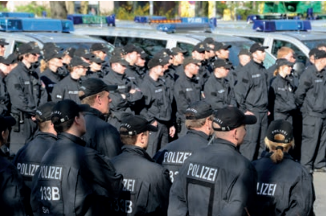
Der Beamtenstatus nach westlichem Muster war für viele Ostdeutsche, die im öffentlichen Bereich gearbeitet hatten, höchst attraktiv: Sie fanden sich unerwartet in besonders stabilen und sicheren Berufen wieder.

lich an. Dementsprechend wäre es zum Zwecke der Konsumglättung angebracht gewesen, unmittelbar nach der Wiedervereinigung, solange die Löhne niedrig waren, wenig zu sparen, um dennoch ein gewisses Konsumniveau zu ermöglichen, und dann später das zusätzliche Einkommen durch den Anstieg in den Löhnen zum Sparen zu verwenden. Das Motiv der Konsumglättung legt also eine steigende Sparquote im Anschluss an die Wiedervereinigung nahe, was aber im Widerspruch zu den Beobachtungen steht.