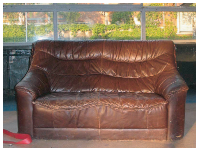
Nicht nur die legendäre Ledercouch aus dem alten KOMM wird überleben. Auch der Flipperautomat und die Discokugel werden im neuen Haus eine Erinnerung an das alte ‚Feeling‘ aufkommen lassen.

spannung. Umgeben ist das zwischen Apotheke und Spielplatz gelegene Gebäude von altem Baumbestand.