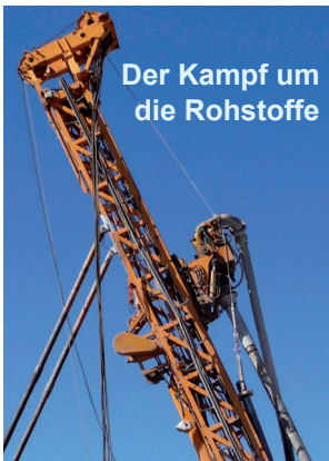
Der Kampf um die Rohstoffe