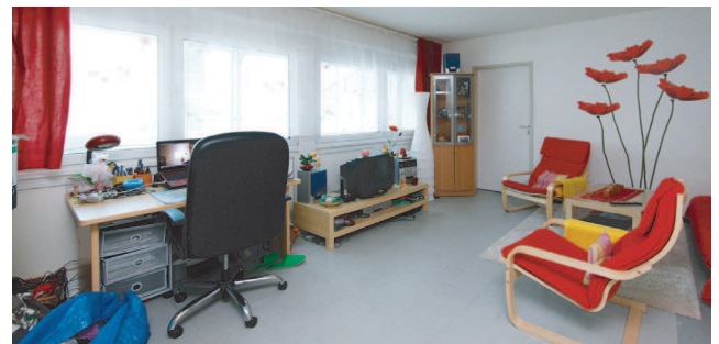
Tausende von Studierenden haben hier bereits gewohnt. Das Wohnheim ‚Ginnheimer Landstraße‘ wurde komplett saniert (Foto links) und neu eingerichtet.

An der Hansaallee entsteht derzeit ein Wohnheim mit 400 Zimmern, das zum Wintersemester 2014 bezugsfertig sein soll. Doch das reicht nicht. „Wir brauchen viel mehr.“ Vor allem, da im kommenden Jahr noch mehr doppelte Abiturjahrgänge an die Hochschulen strömen. Doch in Frankfurt gibt es wenig freie Flächen zum Bauen. Und Bauen ist teuer. Auch private Investoren setzen inzwischen auf Studenten. „Die meisten