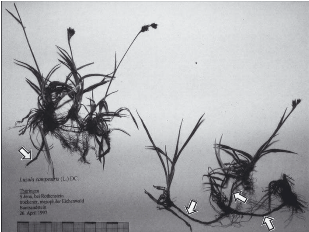
Abb. 4: Habitus von Luzula campestris (L.) DC. bei Jena. April 1997. Die Pfeile markieren die mehrere cm langen Ausläufer.

L. multiflora und L. congesta können - wie oben erwähnt - habituell L. divulgata ähneln, sind aber durch das Antheren-Filament-Verhältnis von \pm 1:1 (bis in Ausnahmen 2:1), den deutlich länglichen, nie kugeligen Samenkörper sowie in der Blütezeit (frühestens Anfang Mai bis Juli) von L. divulgata getrennt.