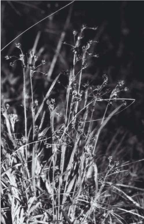
Abb. 1-4: Fotos S. DREYER, April 1997.

Sowohl L. campestris als auch L. divulgata blühen zeitig im Frühjahr , von März bis Ende April.