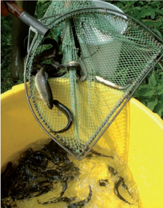
Abb. 1: Besatzfische (Bachforellen) – Stocked brown trout .

Totholz) erkennbar gemacht werden. Die Fische wurden vor dem Besatz gemessen und gewogen. 2007 waren sie im Durchschnitt 184 mm ( \pm Standardabweichung SD 10 mm) lang und 67 g ( \pm SD 13 g) schwer; 2008 181 mm ( \pm SD 13 mm) lang und 63 g ( \pm SD 14 g) schwer. Besetzt wurden vom ersten Abschnitt ausgehend stromab je 150 Fische in die ersten vier Abschnitte. Der unterste Abschnitt wurde nicht besetzt, da man eine passive Verdriftung der Besatzfische befürchtete und somit den letzten Abschnitt als Pufferzone haben wollte. Ausgebracht wurden die Fische flächig vom Boot aus, nachdem sie langsam an die Temperatur des Besatzgewässers akklimatisiert wurden.