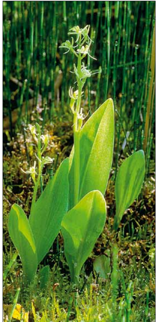
Abb. 1: Liparis loeselii , Habitus fertiler Individuen (Gräfenhainichen, 2.6.2000).

Die Streuwiesen Süddeutschlands (Molineten, Schoeneten) bilden einen dritten Biotoptyp, der von Liparis loeselii erfolgreich besiedelt wird. Für Sachsen-Anhalt