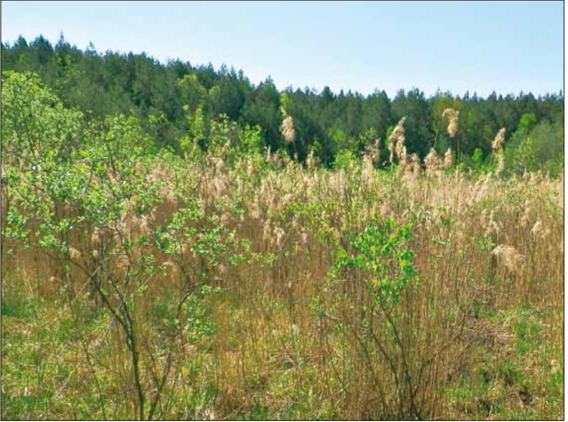
Abb. 5: Biotop von Liparis loeselii in der Bergbaufolgelandschaft (Gräfenhainichen, 1.5.2011).

Verlust dieser Art schien trotz kontinuierlicher Pflege des Fundortes unmittelbar bevor zu stehen. Möglicherweise gehen diese letzten Individuen auf eine im Jahr 1983 durchgeführte Bestandsstützung mit brandenburgischer Herkunft (WEGENER, KALLMEYER & ZIESCHE 2004) zurück, nachdem zwischen 1975 und 1983 keine Nachweise mehr gelangen. Seit 1999 ist an diesem Fundort eine kontinuierliche Bestandskonsolidierung feststellbar, die neben dem Populationszuwachs auch die Neubesiedelung weiterer Teilbereiche umfasst.