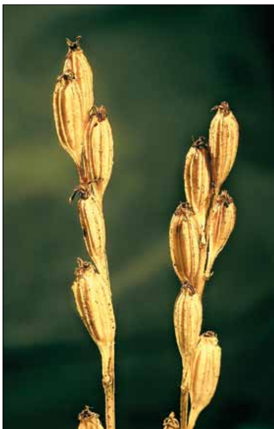
Abb. 7: Liparis loeselii, reife Fruchstände kurz vor dem Öffnen der Samenkapseln (Gräfenhainichen, 3.10.2007).

gen überraschen angesichts der offenbar optimalen hydrologischen Bedingungen und Vegetationsstrukturen. Die Ursache für die geringen Abundanzen der angeführten Arten muss demzufolge im Nutzungsregime gesucht werden. Alle genannten Arten weisen, in Abstufungen, phänologische Besonderheiten auf und schließen ihren jährlichen Entwicklungszyklus (mit der Samenreife) erst spät im Jahr ab: