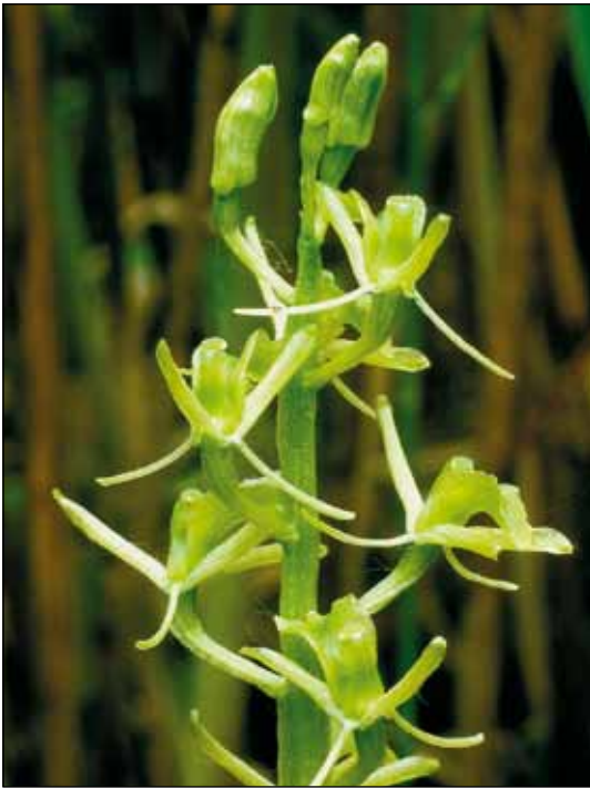
Abb. 2: Liparis loeselii, Einzelblüten (Gräfenhainichen, 23.6.2010).