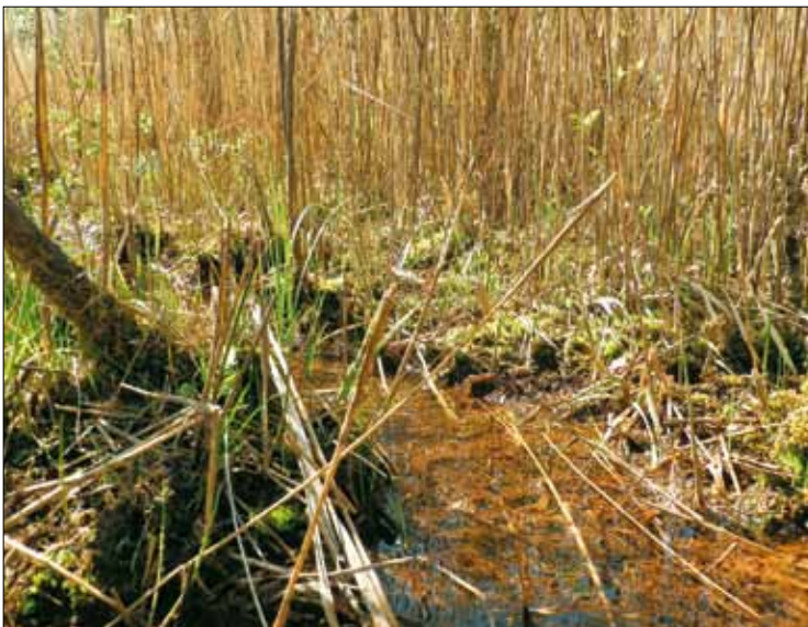
Abb. 3: Vegetationsstrukturen in einem Niedermoorinitial (Gräfenhainichen, 1.5.2011).

Zu Beginn der 1990er Jahre drohte Liparis loeselii aus der Flora unseres Bundeslandes zu verschwinden. Am letzten damals bekannten Fundort im Nördlichen Harzvorland war der Gesamtbestand auf ein bis vier, überwiegend steril bleibende Individuen zurück gegangen. Der