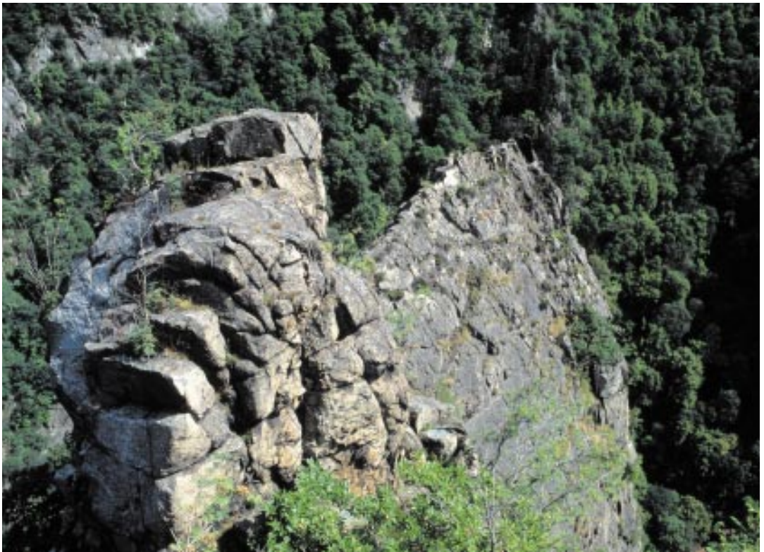
Silikatfelsen im FFH-Gebiet Bodetal und Laubwälder des Harzrandes bei Thale

Sekundäre Standorte wie Mauerspalten sind nicht eingeschlossen.