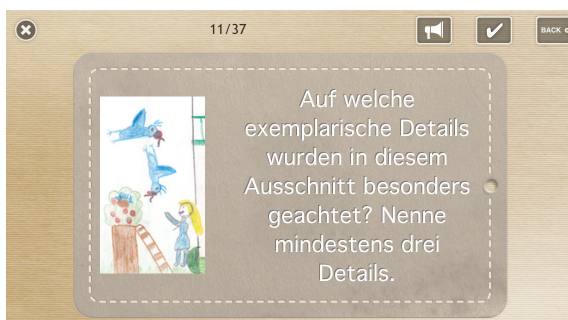
Abb. 1: Vorderseite und Rückseite einer Lernkarte

Eine digitale Lernkarte unterscheidet sich konzeptionell nicht von einer konventionellen, analogen Lernkarte auf festem Papier. Am häufigsten eingesetzt werden solche Karten zum Üben von Vokabeln. In einem Zettelkasten einsortiert, enthält eine Lernkarte in der Regel eine Aufgabe oder Frage auf der Vorderseite und die passende Antwort oder Auflösung auf der Rückseite. Genauso ist auch eine digitale Lernkarte konzipiert. Konventionelle