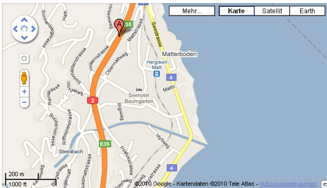
Abb. 2: Karte von Hergiswil. Autobahnabfahrt am Oberen Kartenrand, Hyophila-Standort am unteren