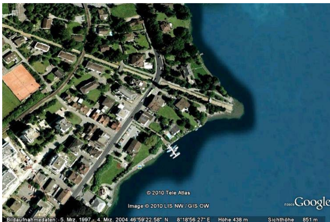
Abb. 3: Lage des Hyophila-Standortes (blaues Quadrat am Seeufer im unteren Teil des Luftbildes).