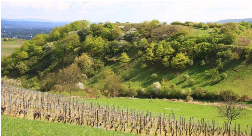
Abb. 2: Blick auf den Westhang des Geschützten Landschaftsbestandteils „Scheerwald“ bei Laubenheim an der Nahe.

Die Böden des Untersuchungsgebietes sind kalkhaltig mit einem pH-Wert im neutralen Bereich. Das Angebot an den wichtigsten pflanzenverfügbaren Nährstoffen ist optimal. Die Weinbergsbrache enthält „Altlasten“ aus ihrer ehemals intensiven Bewirtschaftung (Tab. 1). Die Nährstoffverhältnisse sind mit denen des benachbarten Sponsheimer Berges zu vergleichen (OESAU 2011).