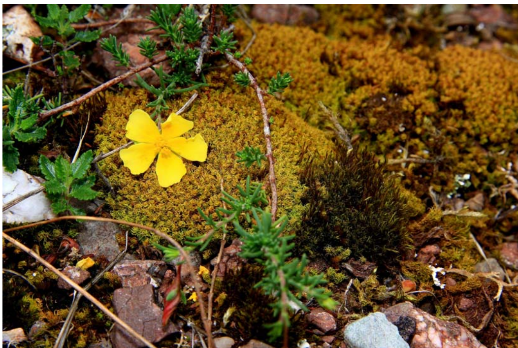
Abb. 3: Tortella tortuosa mit der Cistaceae Fumana procumbens im GLB Scheerwald bei Laubenheim.

Aufgrund der sehr unterschiedlichen Biotopstrukturen im Untersuchungsgebiet können die Moose in verschiedene Stufen der Bodenfeuchtigkeit eingeteilt werden. So fallen (nach DÜLL 2001) Arten der Felstrockenrasen in die Feuchtestufen 1 und 2 (Starktrockniszeiger bis Trockniszeiger), die der lockeren Gebüsch- und westexponierten Magerrasen in die Feuchtestufen 3 und 4 (Trockniszeiger bis Frischezeiger) und die der nordexponierten Wälder in die Feuchtestufen 5 und 6 (Frischezeiger bis Feuchtezeiger). Aus der Gruppe der eigentlichen Feuchtezeiger (Feuchtestufe 7) ist nur eine Art an beschatteten, quellfeuchten Stellen vorhanden: Calliergonella cuspidata (Hedw.) Loeske. In der Tabelle 2 sind die Taxa aufgelistet. Bei der Bewertung ist zu berücksichtigen, dass sich die aufeinanderfolgenden Zeigerwerte überlappen und das ökologische Verhalten eines Taxons innerhalb seines Areals ändern kann.