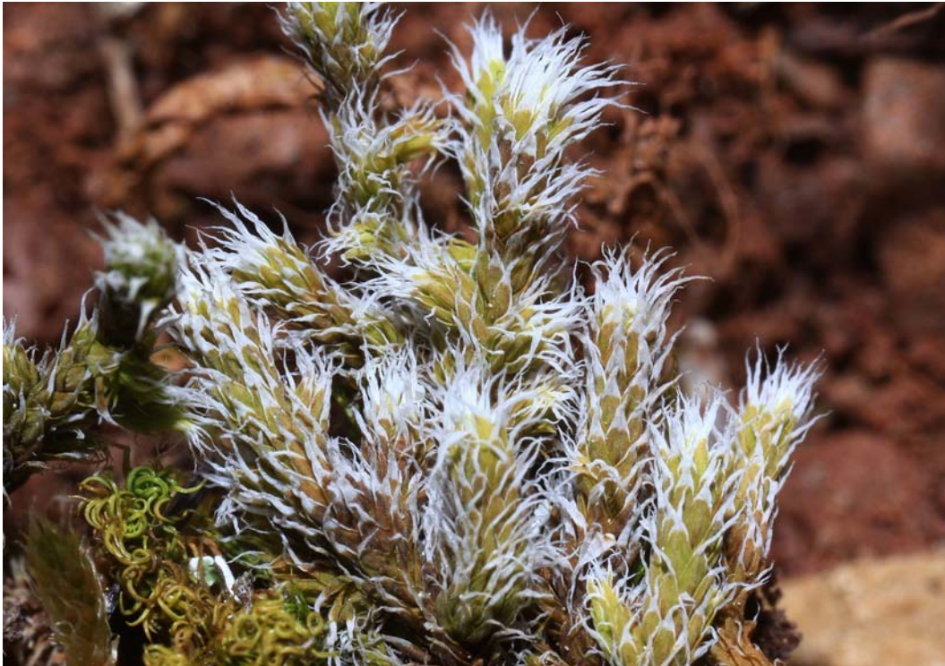
Abb. 4: Racomitrium canescens im Felstrockenrasen des GLB Scheerwald.

Pleurochaete squarrosa (BRID.) LINDB. Racomitrium canescens (HEDW.) BRID. Rhynchostegium megapolitanum (F. WEBER & D. MOHR) SCHIMP. Thuidium abietinum (HEDW.) SCHIMP. Tortula calcicolens W.A. KRAMER Tortula ruralis (HEDW.) GAERTN., E. MEY & SCHERB.