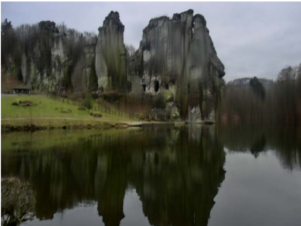
Abb. 4: Die Externsteine