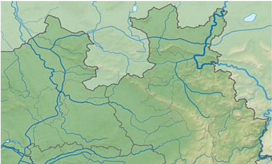
Abb. 1: Verlauf der Landesgrenzen zwischen Niedersachsen und Nordrhein-Westfalen im Gebiet des Teutoburger Waldes und Weserberglandes.