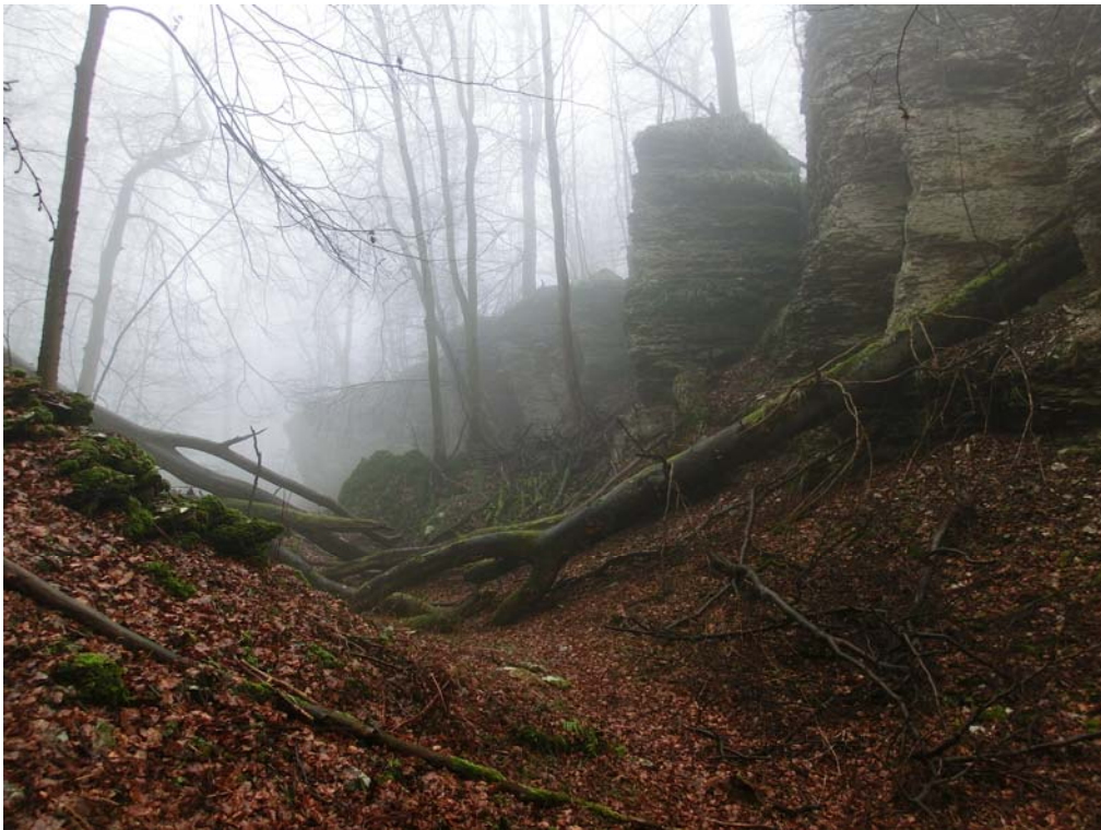
Abb. 3: Die Bielsteinschlucht