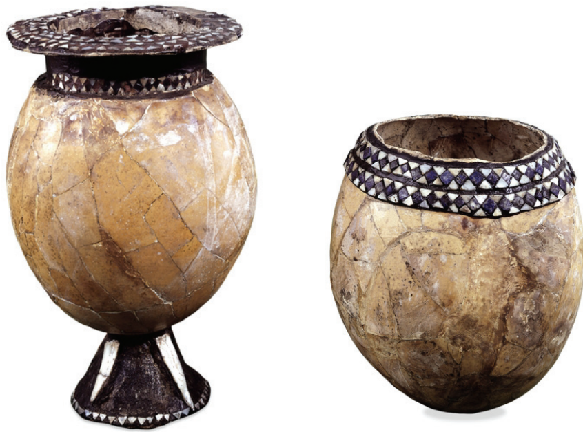
Abbildung 2: Am Rand verzierte Straußeneier aus Ur