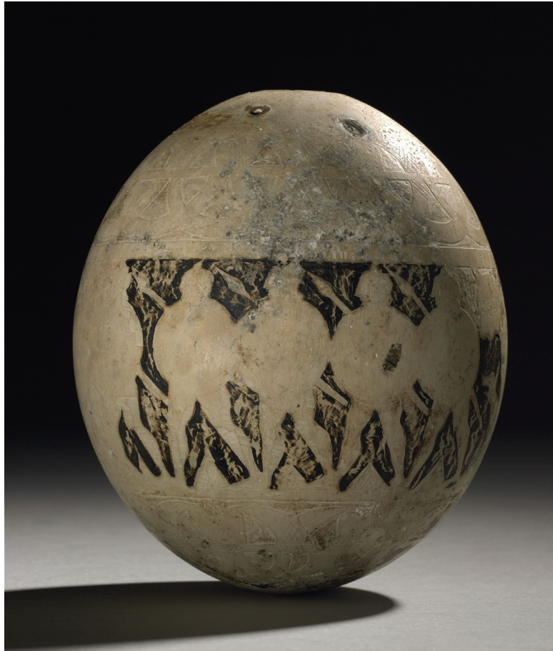
Abbildung 6: Straußenei aus der „Tomba di Iside“, Vulci, mit der Darstellung von bewaffneten Kriegerern. Vermutlich waren die Details der Krieger einst bemalt (mit freundlicher Genehmigung des British Museums, Reg.Nr. 1850,0227.9) © Trustees of the British Museum