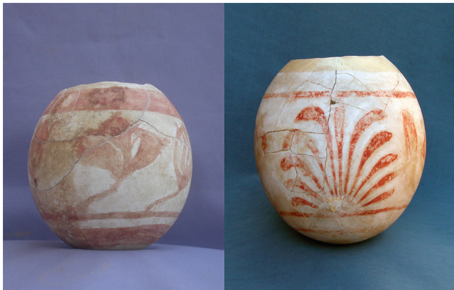
Abbildung 5: Zwei Straußenei-Schalen aus Ibiza (mit freundlicher Genehmigung des Museu Arqueològic d'Eivissa i Formentera, Reg.Nr. 1977 und 2564)