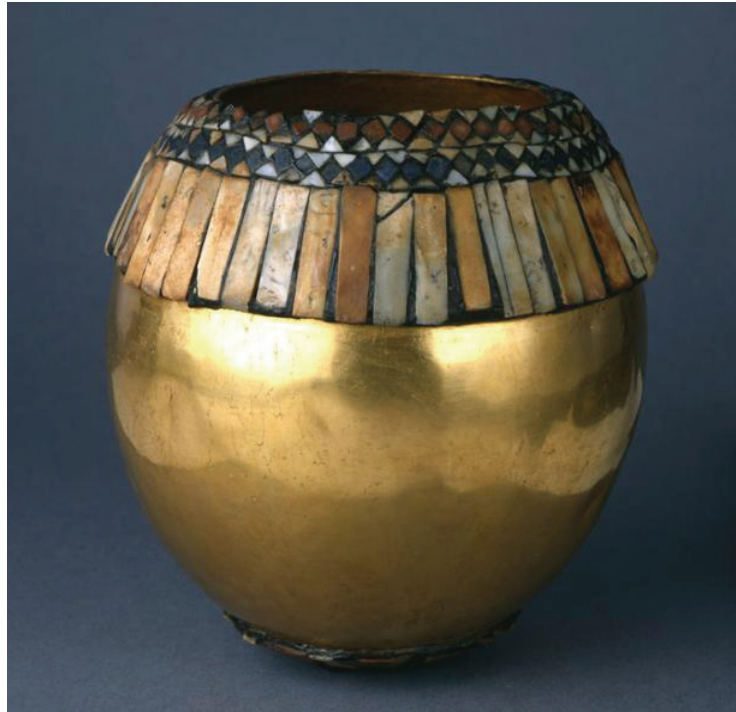
Abbildung 3: Imitat eines Straußenei-Gefäßes aus Gold, Ur, mit einer Verzierung des Randes aus Lapislazuli, Kalkstein, Muscheln und Bitumen (Reg.Nr. B16692).