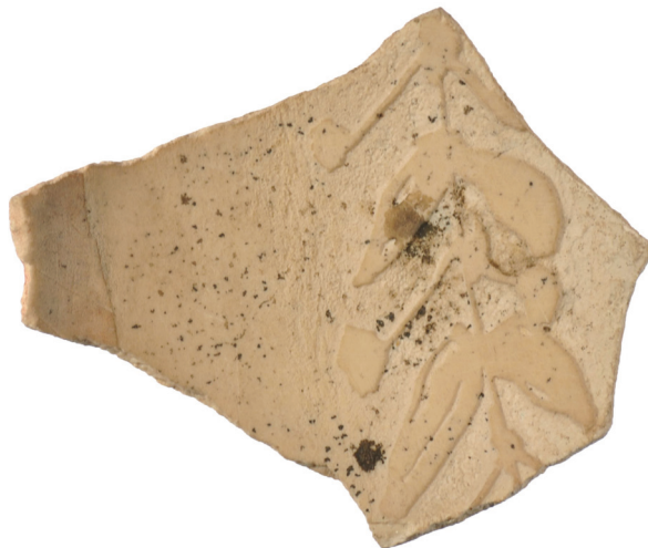
Abbildung 7: Straußenei-Fragment, gefunden im zweiten Apollontempel in Naukratis, ca. 5. Jahrhundert v. Chr. (mit freundlicher Genehmigung des British Museums, Reg.Nr. 1886,0401.1600)