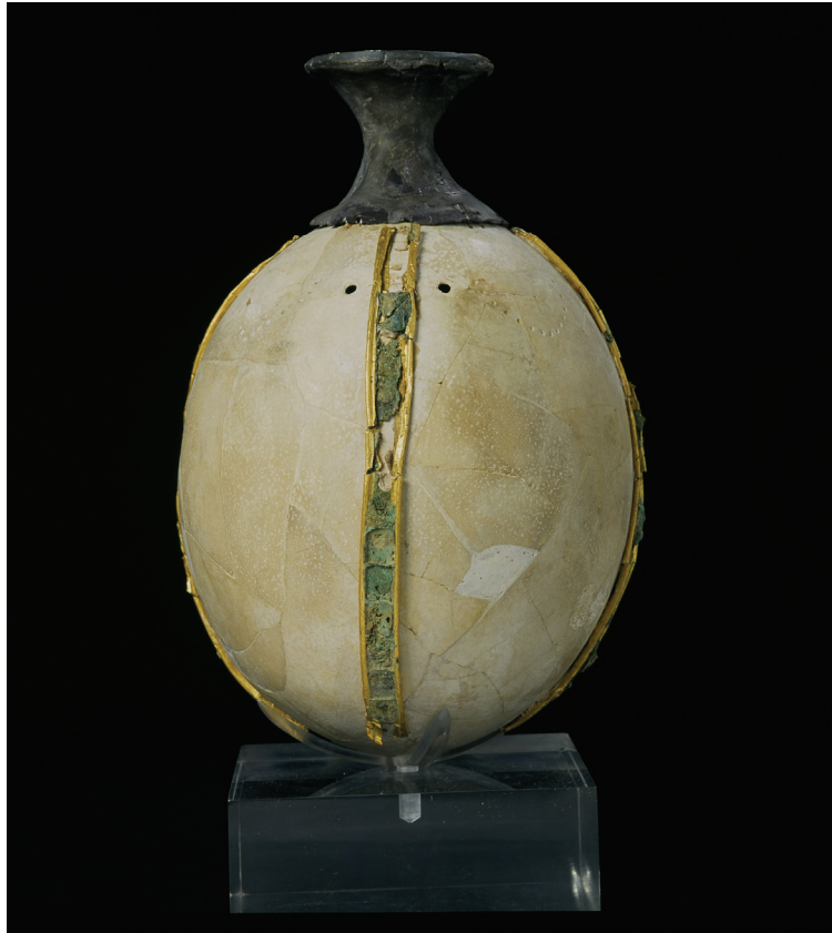
Abbildung 4: Straußenei-Rhyton aus einem Tholosgrab in Dendra (Reg.Nr. 7337)