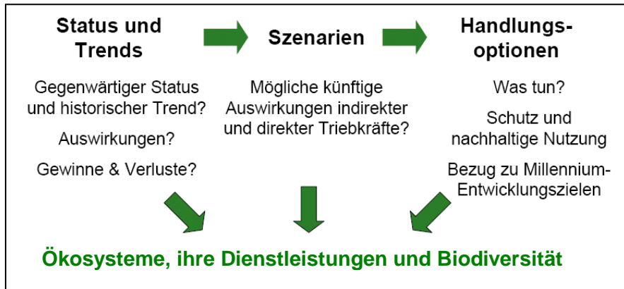
Abb. 1: MA-Betrachtungsebenen (verändert nach Beck et al. 2006b: 13)

Das MA unterteilt sich in drei Berichtsebenen. Im Jahr 2003 wurde zunächst ein Grundlagenband publiziert, welcher wesentliche Analysekonzepte präsentiert. 2005 wurden Syntheseberichte mit unterschiedlichen Schwerpunkten veröffentlicht. Dabei handelte es sich um die Gesamtsynthese, sowie um die Berichte zu den Themen Biodiversität, Desertifikation, Wasser, Feuchtgebiete, Gesundheit, Wirtschaft und Industrie. Kurz darauf erschienen ausführliche Berichte zu den Hauptarbeitsfeldern des Assessment (MEA 2005a: 14).