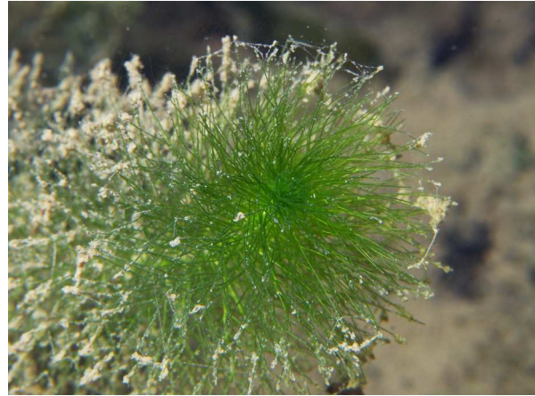
Abb. 6: Myriophyllum alterniflorum (Wechselblütiges Tausendblatt), Blätter (Heideseesee in Nettetal, 2012, K. VAN DE WEYER).

Die Blütezeit liegt im Hochsommer, wobei die Art bei uns nur selten überhaupt blüht. Die Blüten sind überwiegend eingeschlechtlich und einhäusig (monözisch) verteilt, gelegentlich werden allerdings auch zwittrige Blüten beobachtet (HEGI 1966). Die Blüten sind nur 1,5-2 mm lang und besitzen acht Staubblätter, bzw. 4 hellrote Narben (Abb. 7). Die Blüten sitzen an Blütenständen, die mehrere Zentimeter aus dem Wasser herausragen. Im Blütenstand stehen die weiblichen Blüten unten, die männlichen oben. Sie sind meist wechselständig angeordnet, worauf sich der Artname " alterniflorum " (= wechselblütig) bezieht. Bei anderen Myriophyllum -Arten sind alle Blüten gegenständig. Bestäubt werden die Blüten durch Wind. Nach der Befruchtung entstehen ca. 1,5-2 mm × 2 mm große Spaltfrüchte mit vier Kammern. Ihre Ausbreitung erfolgt durch Verdriftung im Wasser. Im Gegensatz zu den beiden anderen einheimischen Myriophyllum -Arten breitet sich M. alterniflorum vorwiegend vegetativ aus (DÜLL & KUTZELNIGG 2011).