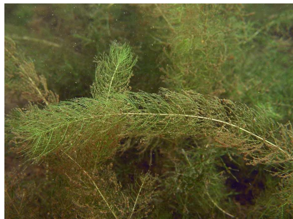
Abb. 4: Myriophyllum alterniflorum (Wechselblütiges Tausendblatt) mit quirlständigen Blättern (Heidesee in Nettetal, 2009, K. VAN DE WEYER).