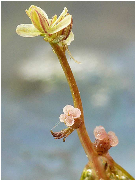
Abb. 7: Myriophyllum alterniflorum (Wechselblütiges Tausendblatt) Blütenstand mit männlichen Blüten (oben) und weiblichen Blüten (unten) (Pflanze aus Kultur, 2011, K. VAN DE WEYER).

Die Blütezeit liegt im Hochsommer, wobei die Art bei uns nur selten überhaupt blüht. Die Blüten sind überwiegend eingeschlechtlich und einhäusig (monözisch) verteilt, gelegentlich werden allerdings auch zwittrige Blüten beobachtet (HEGI 1966). Die Blüten sind nur 1,5-2 mm lang und besitzen acht Staubblätter, bzw. 4 hellrote Narben (Abb. 7). Die Blüten sitzen an Blütenständen, die mehrere Zentimeter aus dem Wasser herausragen. Im Blütenstand stehen die weiblichen Blüten unten, die männlichen oben. Sie sind meist wechselständig angeordnet, worauf sich der Artname " alterniflorum " (= wechselblütig) bezieht. Bei anderen Myriophyllum -Arten sind alle Blüten gegenständig. Bestäubt werden die Blüten durch Wind. Nach der Befruchtung entstehen ca. 1,5-2 mm × 2 mm große Spaltfrüchte mit vier Kammern. Ihre Ausbreitung erfolgt durch Verdriftung im Wasser. Im Gegensatz zu den beiden anderen einheimischen Myriophyllum -Arten breitet sich M. alterniflorum vorwiegend vegetativ aus (DÜLL & KUTZELNIGG 2011).