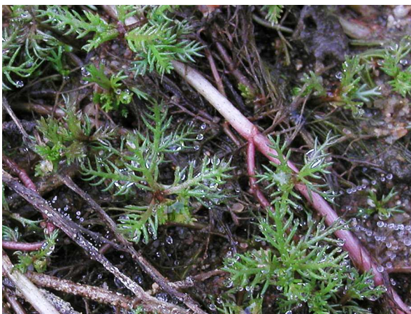
Abb. 3: Myriophyllum alterniflorum (Wechselblütiges Tausendblatt), Landform (Wolfssee in Duisburg, 2003).

Die Blätter von Myriophyllum alterniflorum stehen in meist vierzähligen Quirlen, sind oft aber auch wechselständig angeordnet. Sie bestehen aus 8-18-fädigen Fiedern (Abb. 4 & 6). Durch diese starke Zerteilung der Blätter kommt die Gattung zu ihrem Namen "Tausendblatt", was der fast wörtlichen Übersetzung des aus dem Griechischen stammendem Myriophyllum = "unzählige Blätter" entspricht. Myriophyllum alterniflorum bildet selten auch Landformen aus (Abb. 3).