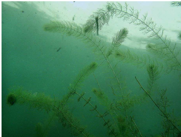
Abb. 1: Myriophyllum alterniflorum (Wechselblütiges Tausendblatt) im Wolfssee in Duisburg (2003, K. VAN DE WEYER).

Bei der Wasserpflanze des Jahres ist es in diesem Jahr sogar zu einer Doppelbenennung gekommen: Während der Verband Deutscher Sporttaucher ( www.vdst.de , www.wasserpflanze-des-jahres.org ), der diese Kategorie auch in den letzten Jahren kürte, das Wechselblütige Tausendblatt wählte, wurde vom Förderkreis Sporttauchen kommuniziert, dass es sich beim Igelschlauch ( Baldellia ranunculoides ) um die Art des Jahres in der Kategorie Wasserpflanzen handele. Nun ist die Verwirrung groß. Nachdem Baldellia ranunculoides beim Bochumer Botanischen Verein bereits durch ein Porträt von GAUSMANN (2014) vorgestellt wurde, erfolgt nun der Vollständigkeit halber eine entsprechende Ausführung zu Myriophyllum alterniflorum .