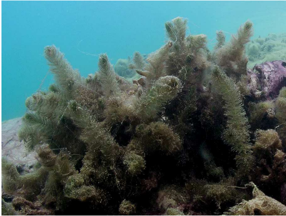
Abb. 5: Myriophyllum alterniflorum (Wechselblütiges Tausendblatt) (Heideseesee in Nettetal, 2009).