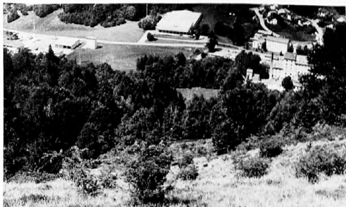
Abb. 3a: Mit Crataegus monogyna durchsetzter Teil des Festuco-Genistetum sagittalis im oberen Teil der Untersuchungsfläche im Jahre 1976.