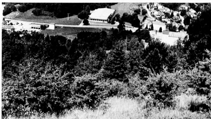
3b: Dieselbe Stelle im Jahre 1988 (unten): es haben sich vor allem durch Kronenzuwachs Gebüsch vom Typ eines artenarmen Pruno-Ligustrum gebildet (s. Tab. 6).

perforatum weist geringe Stetigkeit auf. Arten, die im Weidfeld in den letzten 12 Jahren abgenommen haben, treten auch in den Gebüschern nicht auf.