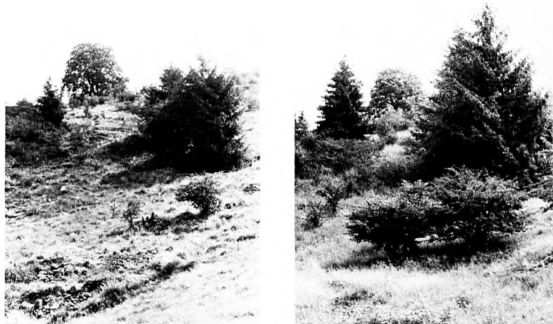
Abb. 2a: Teil des Weidfeldes „Flüh“ im Jahre 1976 mit einzelnen Crataegus monogyna -Büschchen u.a. Im Hintergrund: Weidbuche ( Fagus sylvatica ). 2b: Dieselbe Stelle im Jahre 1988 (rechts): es ist zu Verdichtungen der Gebüschke gekommen (im Vordergrund: Carpinus betulus links, Crataegus monogyna rechts; die Steinrasseln im Vordergrund wurden größtenteils überwachsen).

Ausbreitung dieser Sippe aus umgebenden S-exponierten Weidfeldern ist leicht vorstellbar. Die Krautschicht dieser bis maximal 6 m 2 großen Bestände wird durch Saumpflanzen ( Teucrium scorodonia , Holcus mollis ) und – in den Spalten von kleinen Steinblöcken wurzelnd – Vaccinium myrtillus geprägt.