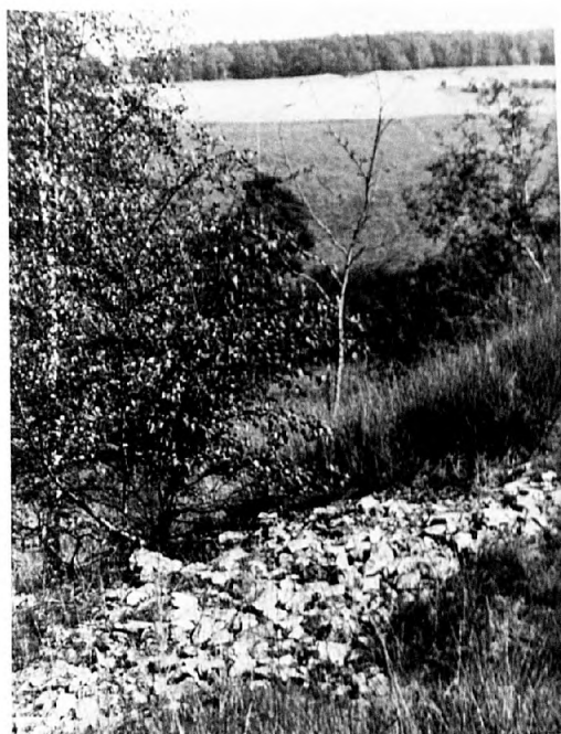
Abb. 4: Blick auf die Schotterflur, Richtung E (21.9.91).