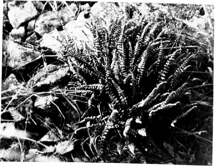
Abb. 3: Asplenium x poscharskyanum im groben Schotter (21.9.91).