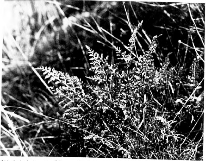
Abb. 2: Asplenium cuneifolium am Wuchsort (21.9.91).