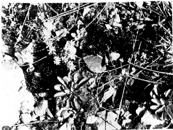
Abb. 5: Übersicht der Plateauvegetation mit Thlaspi , Galium , Flechten u. Moosen (21.9.91).