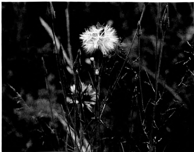
Abb. 1: Scorzonera laciniata L. an der Asse (nördliches Harzvorland).

Scorzonera laciniata ist eine zartwüchsige, wenig auffällige zitronengelb blühende Kompositenart. Aus einer dünnen Pfahlwurzel wird zumindest ein aufrechter Stengel getrieben. Die Laubblätter sind in der Regel fiederspaltig, wobei die Blätter von Jungpflanzen öfter pfriemlich und ungeteilt sind. Abbildungen dieser Art finden sich bei HEGI (1987), ROTHMALER (1987)