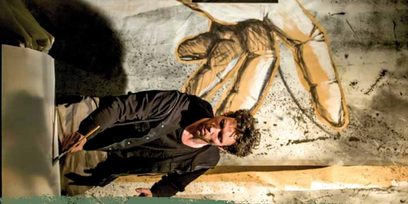
Nothing Twice (UA)