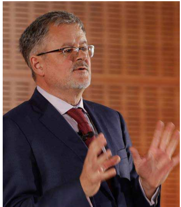
Nachdenklich und pointenreich: der Vortrag von Sir Christopher Clark, Professor für Neuere Europäische Geschichte an der Cambridge University, beim Festakt am 18. Oktober.