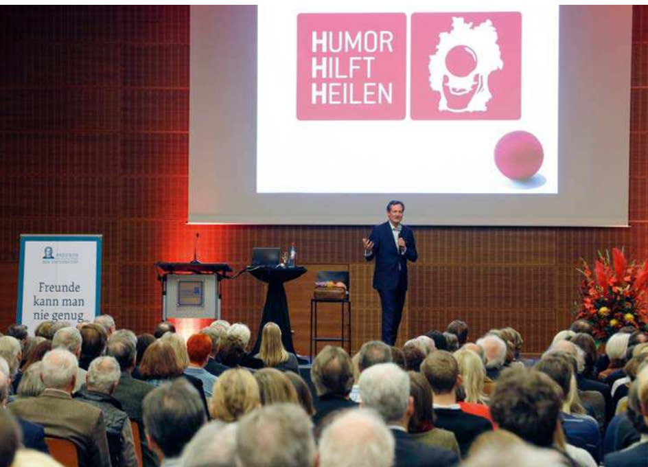
Amüsant und geistreich: Der Mediziner, Fernsehmoderator und Autor Dr. Eckart von Hirschhausen bei der Auftaktveranstaltung im November 2017.

Rückblick auf das Jubiläumsjahr der Freundesvereinigung