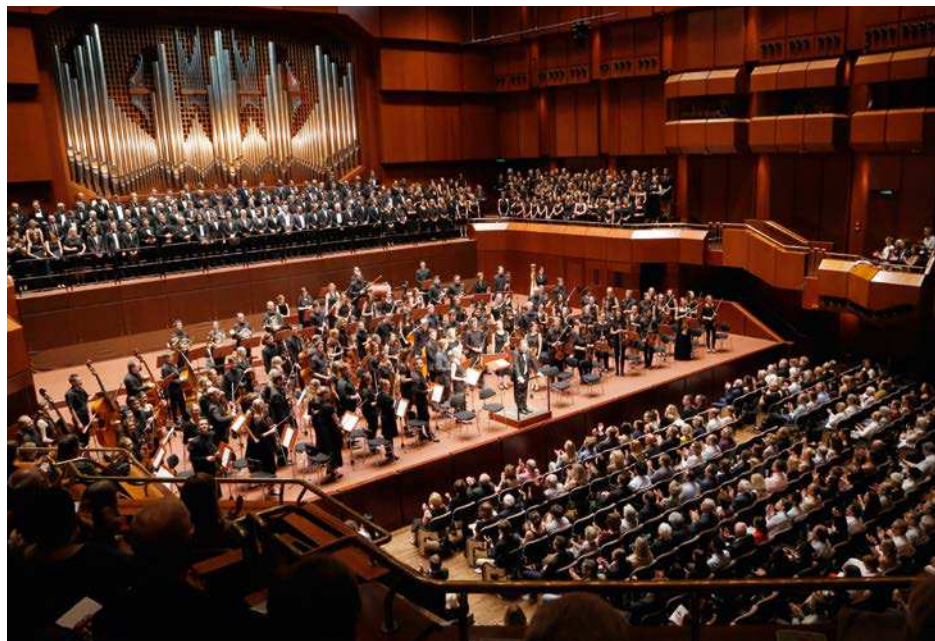
Der Chor des Collegium Musicum steht allen Studierenden, Mitarbeitenden und Ehemaligen der Universität offen.