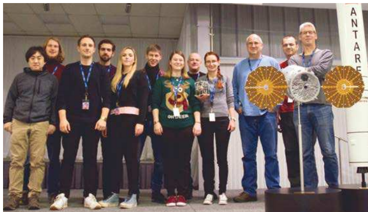
Vor dem Start: Das EXCISS-Team in Virginia (USA) mit einem Modell seines Experiments.

Studentisches »Überflieger«-Experiment auf der Raumstation ISS