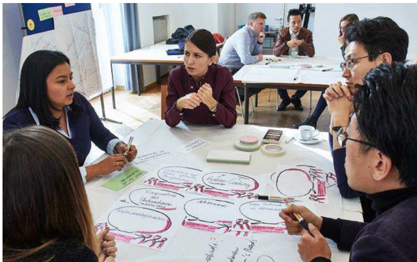
Das Internationale Studierenden-Alumni-Netzwerk wird aus Mitteln des Europäischen Sozialfonds und aus Mitteln des Landes Hessen gefördert.

Internationale Alumni unterstützen internationale Studierende in Frankfurt