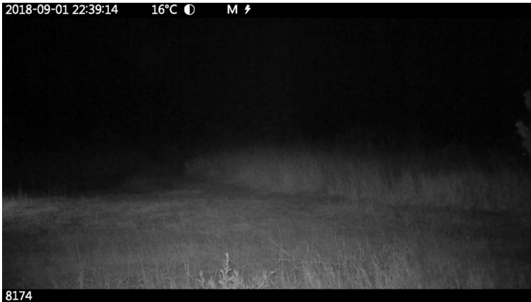
Abb. 2. Film-Still, SaF05 , Regie: Charlotte Prodger

das Licht der Kamera. Um 22:38:01 steht die Löwin gemächlich auf, macht einen leichten Buckel zur Dehnung und beginnt zu brüllen, indem sie den Kopf jeweils lang nach vorne zieht. Um 22:38:16 gibt es wieder einen Schnitt, auf eine andere Kamera, gleiches Datum, 22:39:02, 16 Grad. SaF05 läuft kurz links unten mit dem Kopf ins Bild, bleibt stehen, guckt und lauscht und dreht sich dann um 22:39:12 wieder links herum aus dem Bild. Die Kamera filmt weiter, und Prodger nimmt noch weitere 16 Sekunden mit in ihren Film (s. Abb. 2).