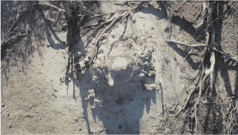
Abb. 4. Film-Still, SaF05 , Regie: Charlotte Prodger (Copyright Hollybush Gardens, Charlotte Prodger, 2019).

ten, die den unterschiedlichen Aufnahmemedien zugrunde liegen, und stellt sie in einen queeren Kontext. Die Drohne z. B. wurde zunächst für das Militär entwickelt und von Deutschland in Kriegen wie in Afghanistan und dem Kosovo eingesetzt. In 'Desert Radio Drone' zeigt Ursula Biemann, wie Überwachungsdrohnen auf der Suche nach Migrant*innen im Grenzgebiet des südlichen Libyen eingesetzt werden, »transmitting televisual data back to a remote receiver in real time«. 16 Interessanterweise nutzt Prodger die Drohne nicht in diesem Sinne, um sie z. B. in die Suche nach SaF05 einzubinden (und damit die Suche nach Migrant*innen auf die nach der Löwin zu verschieben). Sie nutzt die Drohne allein, um die Termitenhügel zu fokussieren (s. Abb. 4), die sie im Okavango Delta vorfindet und die sie von der Löwin abzulenken scheinen, wie Bruneau schreibt: