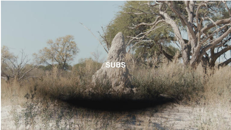
Abb. 5. Film-Still, SaFOS , Regie: Charlotte Prodger (Copyright Hollybush Gardens, Charlotte Prodger, 2019).

Botswana und damit dem afrikanischen Kontinent. Und, damit zusammenhängend, geht es um das, was wir sehen, und das, was wir nicht sehen, was vor uns verborgen bleibt. Beide Perspektiven auf den/die Termitenhügel fokussieren die überirdische Struktur; das Kameraauge sieht in diesem Sinne nicht mehr als das menschliche Auge, denn der größte Teil der Termitenhügelstruktur bleibt weiterhin verborgen (was vielleicht mit der extremen Fokussierung von der Seite, in der das Bild an seine Grenzen kommt und verschwimmt, deutlich wird). 20 Von oben wird die nördlich ausgerichtete Spitze des Hügel fokussiert, der in der Region etwa bei 19 Grad liegt, was mit dem durchschnittlichen Sonnenstand in der Region korrespondiert 21 und auf Prodgers Entscheidung verweist, die Drohnenaufnahme dann zu machen, wenn die Sonne am höchsten steht. Wir sehen von den unterschiedlichen