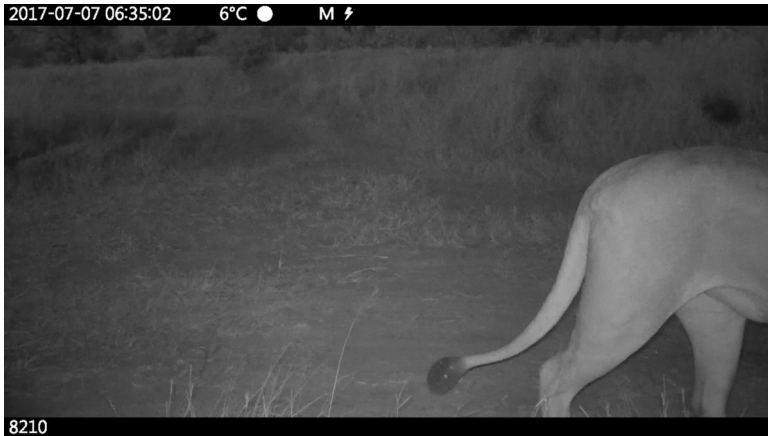
Abb. 1. Film-Still, SaF05 , Regie: Charlotte Prodger (Copyright Hollybush Gardens, Charlotte Prodger, 2019).

6:36:12 folgt ein zweiter Schnitt. Das Tier, dessen Vorderseite noch immer nicht zu sehen ist, beginnt um 6:38:32 sich aus dem Kamerafokus herauszubewegen. Mittlerweile sind es sieben Grad. Zu sehen ist die Raubkatze bis zum nächsten Schnitt nicht mehr, aber zu hören: Langsam steigert sie sich in ein Brüllen ( roaring ), das als Zeichen der Dominanz und Markierung des Raumes mit männlichen Löwen assoziiert wird.