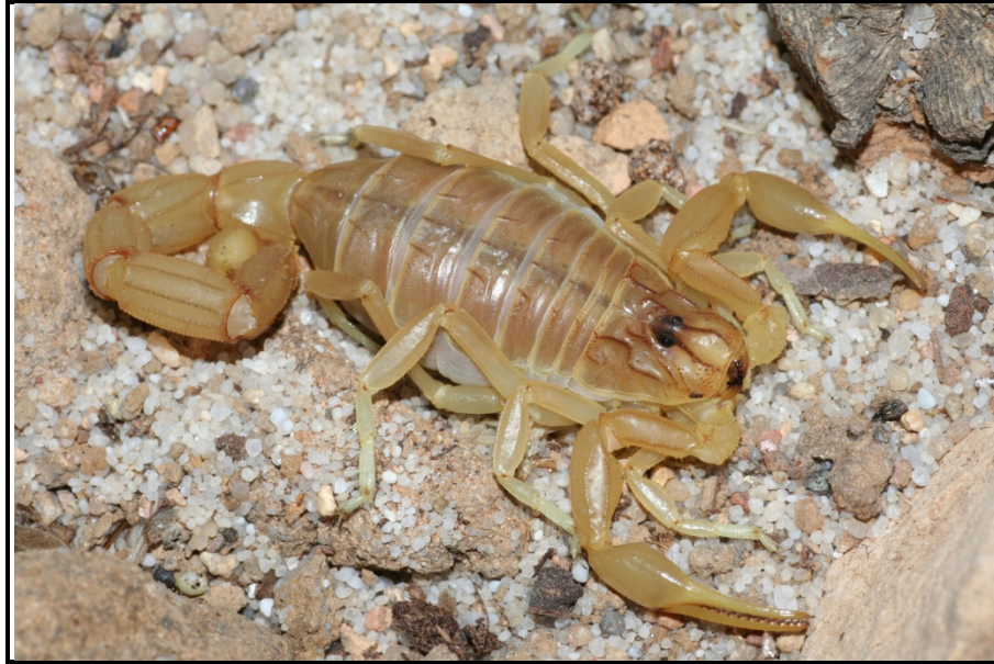
Buthus atlantis.

Buthus aures Lourenço & Sadine, 2016 AFRIQUE. Algérie (région de Batna)