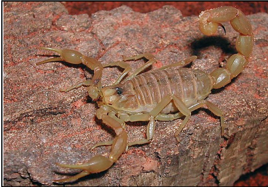
Buthus occitanus (France)