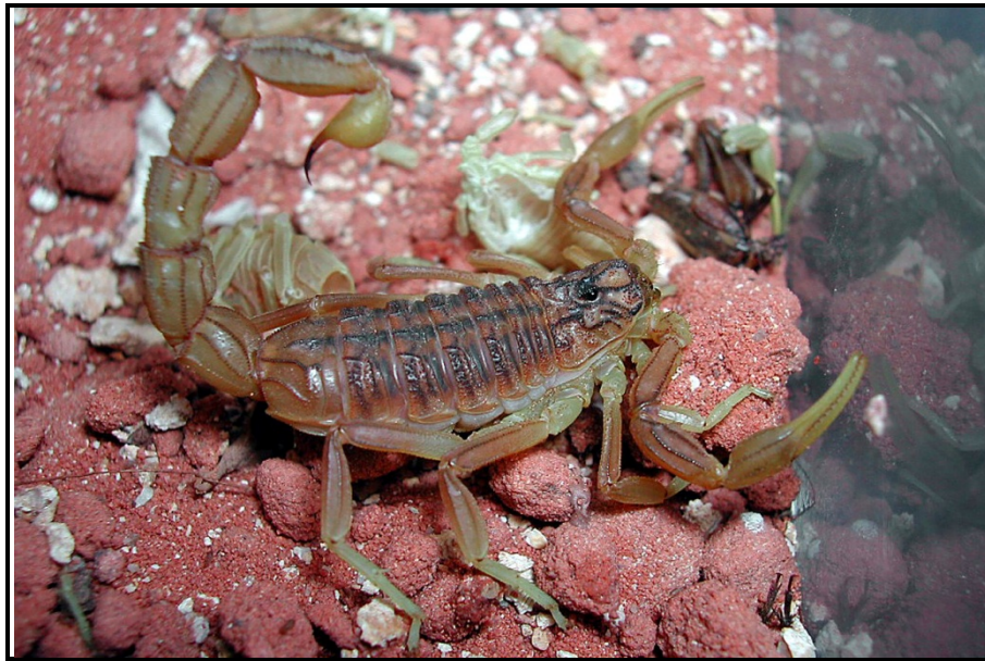
Buthus malhommei.

AFRIQUE. Maroc (bassin de l'Oum Errabiâ)