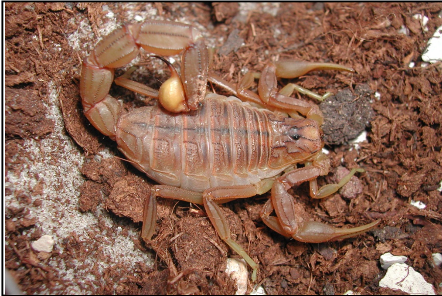
Buthus montanus

Buthus nabataeus Lourenço, Abu Afifeh & Al-Sarairoh, 2021 ASIE. Jordanie (Sud-ouest)