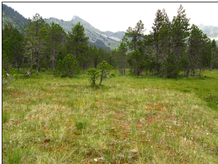
Tourbière de Sommand

Pour les Alpes, trois citations anciennes, elles aussi relevées par Jean-Pierre Coutanceau dans la collection Christian Duverger au MNHN : deux des Hautes-Alpes (Vallouise, août 1920, 7 ex. et Abriès, juillet 1933, 17 ex.) et une de l'Isère (Saint-Christophe, août 1921, 1 ex.). Mon observation en Haute-Savoie étend à un nouveau département l'aire de distribution alpine et met fin à près de 80 années "d'éclipse" pour l'espèce dans la partie française du massif.