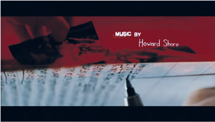
Abb. 3: Dunkelkammer und Notizbuch als Orte der Schreckensproduktion (Screenshot aus SE7EN)

und Dunkelkammer, Schrift und Fotografie – in ihrem lethalen Zusammenwirken vereint werden. [Abb. 3]