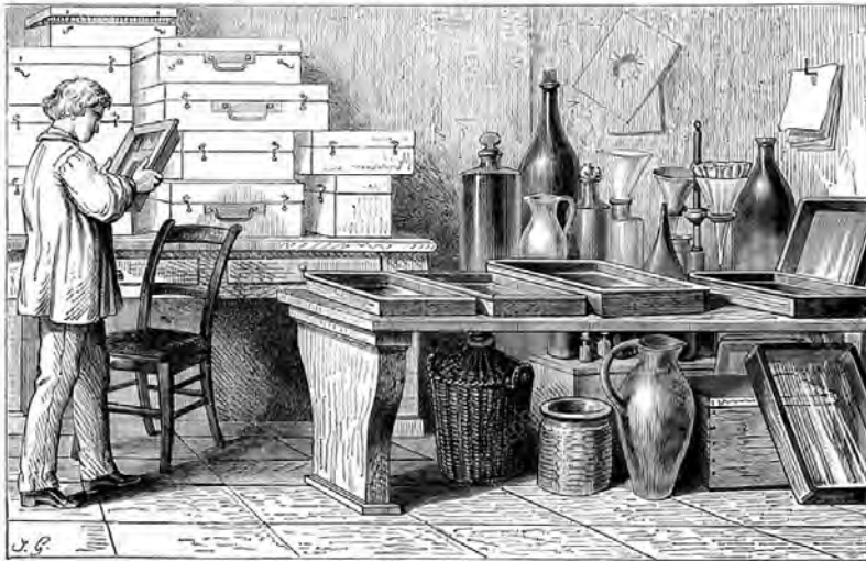
Abb. 1: Darstellung einer Dunkelkammer in der populärwissenschaftlichen Wochenzeitschrift ‚La Science Illustrée‘, Vol. 8, 2/1891.

Der Raum der fotografischen Aufzeichnung figuriert hier also als doppelte Grenzziehung: zum einen als Moment der räumlichen wie sozialen Abgrenzung, zum anderen zeichnet sich hierin schon die produktionstechnisch unumgängliche Funktion einer Lichtschleuse ab, nach der das Prozessieren der fotografischen Platten ja verlangte. Die Dunkelkammer ist also in jeder Hinsicht mit einem Schwellenphänomen assoziiert, einer Zone des Übergangs, die sozial, technisch und funktional reguliert und definiert ist. In dieser Separierung scheint aber auch eine Kodierung als Abjekt 9 , als dunkler Ort der Exkremente des fotografischen Produktionsprozesses auf, der in jeder Hinsicht den Augen des Atelierpublikums entzogen bleiben sollte – in der späteren technischen Ausgestaltung gewissermaßen ein red light district der Bildherstellung. Dass die Dunkelkammer ihrerseits nicht selbst zum fotografischen Objekt werden konnte, lag natürlich zuvorderst an den damaligen Limitationen des zur Verfügung stehenden elektrischen Lichts. Desungeachtet schreibt sich das angesprochene Schisma aber auch darin fort, dass es zahlreiche zeitgenössische Aufnahmen von Ateliersituationen gab, während von der Dunkelkammer lediglich Stiche in populärwissenschaftlichen Magazinen zirkulierten [Abb. 1].