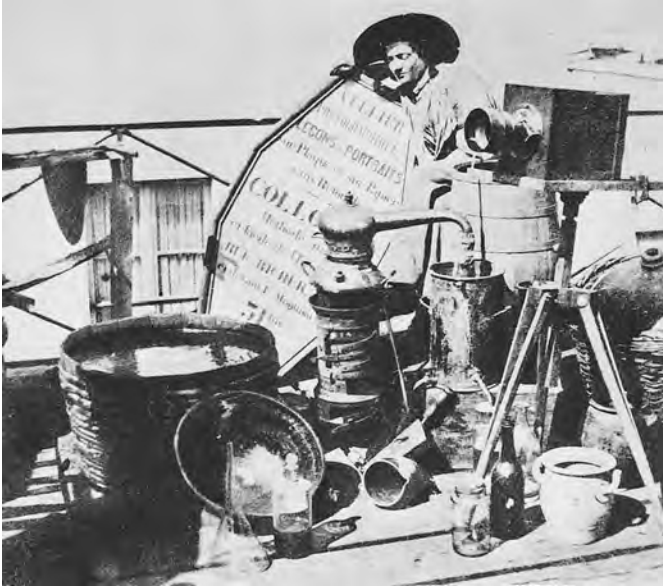
Abb. 2: Felix J. A. Moulin mit seinen fotografischen Materialien. Paris, 1860er Jahre

Hier kommen sie nun also doch einmal zusammen, die Elemente der Aufnahme- und der Entwicklungssituation, erstere durch die dominante Kamera auf Stativ, letztere durch eine Vielzahl von Zubern, Krügen und Gläsern repräsentiert, die natürlich die tatsächlichen fotochemischen Abläufe im Labor bestenfalls metonymisch abrufen.