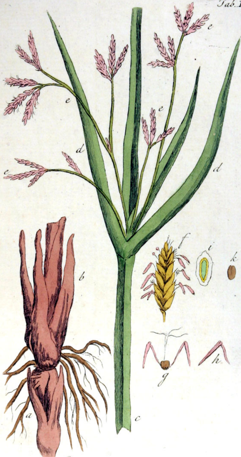
Cyperus longus L.