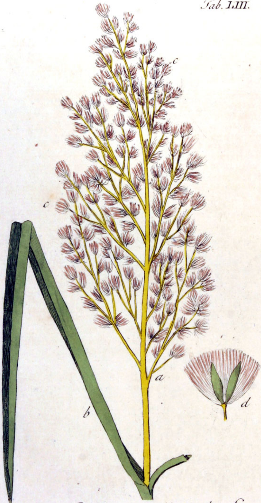
Saccharum officinale L.