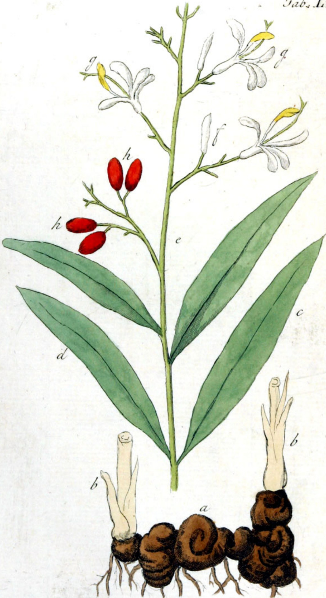
Marantha Galanga L.