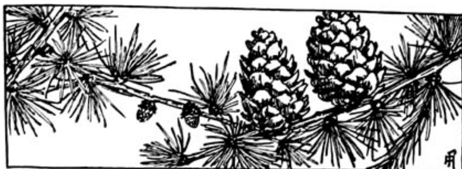
Probekbild aus Naturwissenschaftliche Beobachter Serie A, Band 4: Feucht, Die Bäume und Sträucher unserer Wälder.