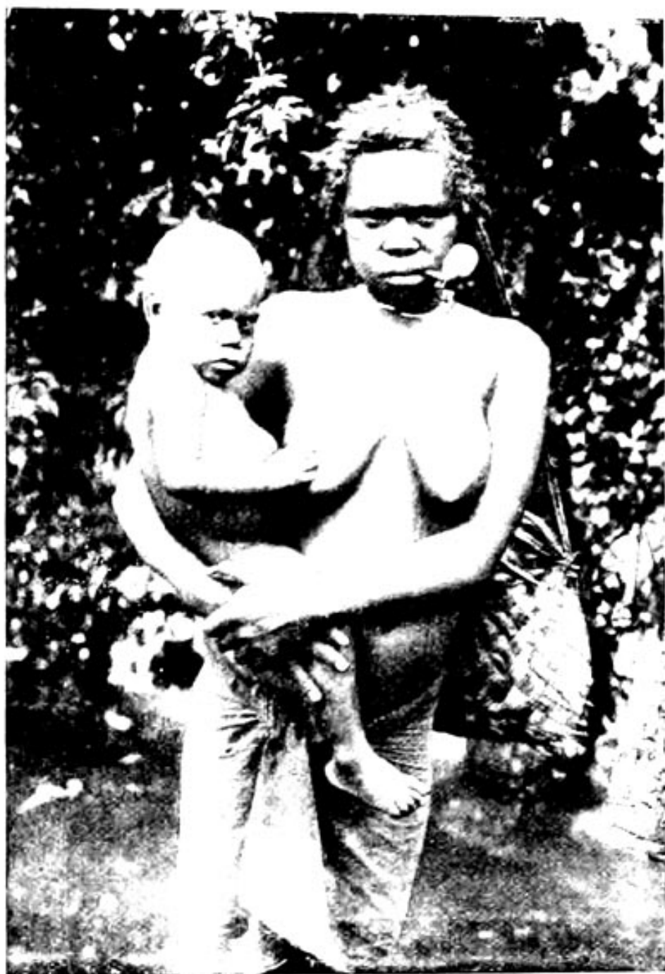
Mutter mit Kind, Gazellehalbinsel Vobebud aus Darwin, Dreißig Jahre in der Südsee

Verlag von Strecker & Schröder in Stuttgart