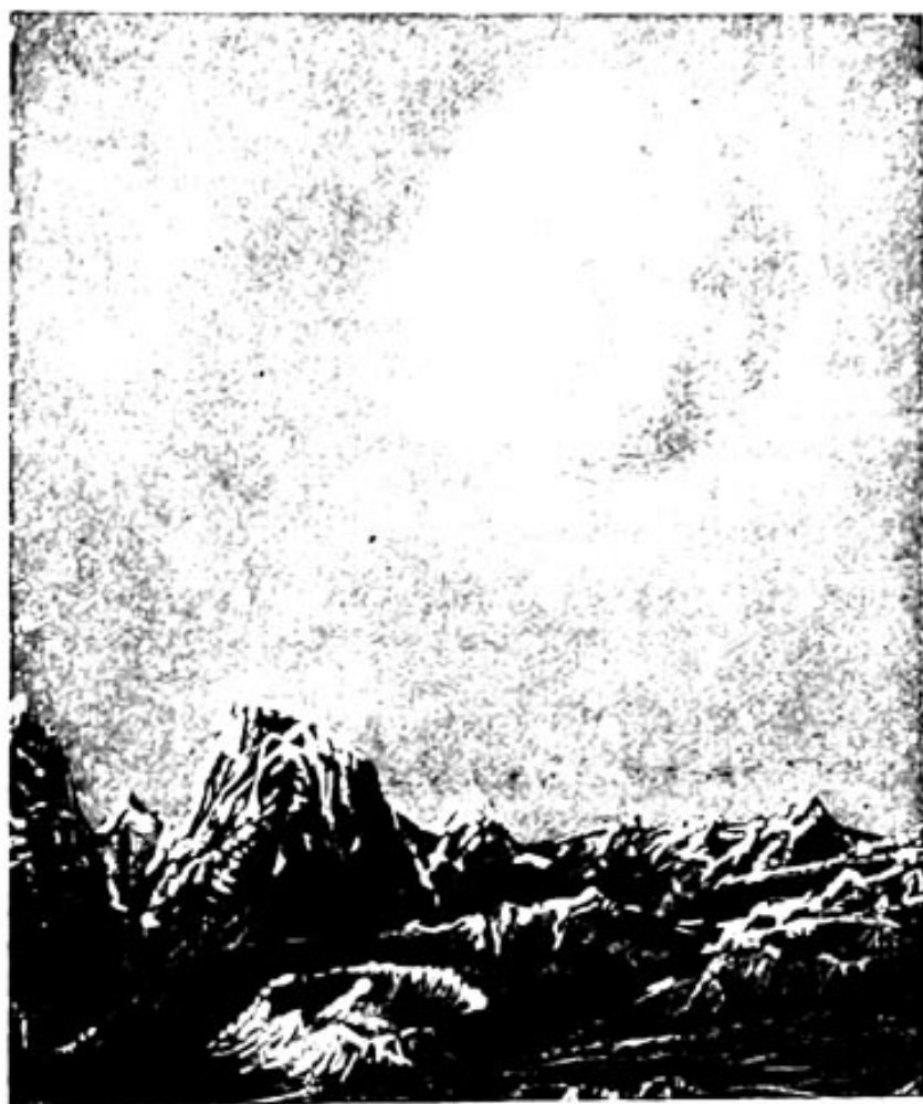
Verkleinertes Probebild aus Naturwissenschaftliche Begleiter Serie B, Band 1: Messerschmitt, Die Erde als Himmelskörper.

Jeder Band Serie A (Klein-Oktav) geheftet M 1.—, elegant gebunden M 1.40, Serie B (Mittel-Oktav) geheftet M 2.—, elegant gebunden M 2.80. Jeder Band bildet ein abgeschlossenes Ganzes und ist einzeln käuflich.