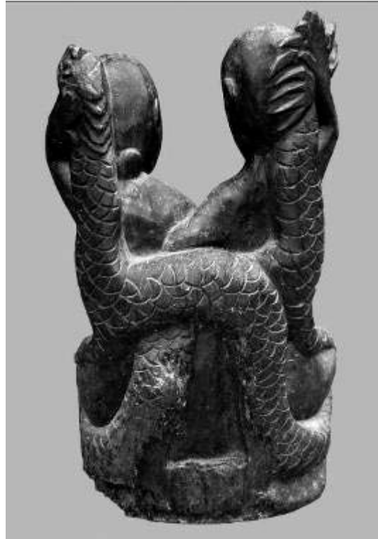
Abbildung 4: Kwae-Kelake-Skulptur, die Urahn von Helangdohi

Nach Meinung meines Gesprächspartners betont die Darstellung die besondere Bedeutung von Frauen. Ein im Verhältnis zur dargestellten Frau sehr kleiner Mann symbolisiert, daß Männer nur existieren, weil es Frauen gibt. Die Erklärung betont die besondere Bedeutung von Frauen, was sich gut in die allgemeine Auffassung der Bewohner von Helangdohi einfügt. Das Dorf gilt als ein weibliches Dorf, dessen Bewohner die Aufgaben haben, zu schützen, zu vermitteln und Hilfesuchende zu unterstützen. 20 Die vorgebrachte Motivanalyse, die die Proportionen der Skulptur berücksichtigt, ist auch aus einem weiteren Grund bemerkenswert: Mein Gesprächspartner war der einzige, dessen Beschreibung dem entsprach, was auch ich in dem Dargestellten sehen konnte. Ich vermute daher, daß er selbst schnitzte und sich als Künstler Gedanken darüber machte, wie er eine Geschichte szenisch darstellen konnte. Seine handwerklichen Fähigkeiten zeigte er an den beiden Ahnenfiguren im Wald von Helangdohi. Ob er auch künstlerisch begabt ist und in der Lage wäre, Skulpturen zu schnitzen, wie sie sich in der europäischen Sammlung befinden, vermag ich nicht zu sagen. Es ist aber klar, daß diese Sammlung nicht aus seiner Werkstatt stammt, denn eine von den Sammlern in Auftrag gegebene C 14-