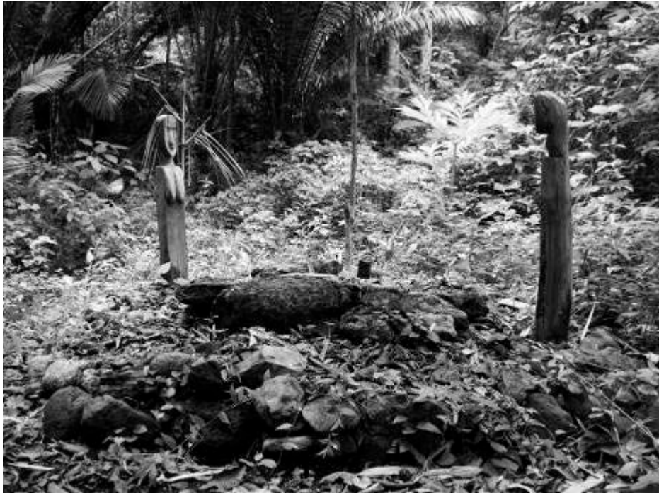
Abbildung 2: Die Urahen Helang und Dohi auf dem Ritualplatz im Wald

Nachdem die Sammler, der Händler und ich einmal in Helangdohi übernachtet hatten, wurden wir von einem Mann des ranghöchsten Clans des Dorfes, Being, gemeinsam mit einem Mann des Clans Marang, der im Begriff war, sein Clanhaus neu zu bauen, in den Ahnenwald des Dorfes geführt. Die beiden Männer wollten uns neugeschnitzte anthropomorphe Skulpturen zeigen: Skulpturen, die die Urahen, die Frau Helang und den Mann Dohi, darstellen (Abb. 2). 9 Sie waren als Büsten geschnitzt, deren untere Körperteile in einen Baumstamm übergehen und in der Erde stecken. Es handelte sich im eigentlichen Sinn um Ahnenfiguren, die zwar neu geschnitzt wurden, aber als besonders alt gelten, weil sie den Urahen des Dorfes Helangdohi vorübergehend als „Körper“ dienen und weil es dadurch möglich ist, zu den Dorfgründern Kontakt aufzunehmen. Die Skulpturen wurden von einem handwerklich geschickten Mann aus Helangdohi geschnitzt. 10 Nur den letzten Schnitt nahm der Älteste des Clans Being vor und machte sie somit zu Figuren, die als von ihm persönlich geschnitzt galten.