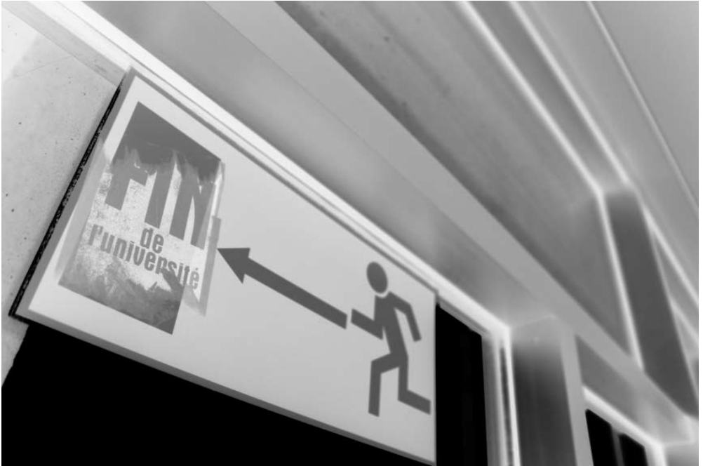
last exit BOYKOTT

mit den modularisierten Studiengängen kompatibel ist. Vor allem der Bachelor mit seinem absurd hohen „Workload“ muss auf einer Lehre basieren, die aktuelles, ausschließlich „praxisrelevantes“ Wissen in möglichst kurzer Zeit vermittelt. Studierende sollten sich nicht noch weiter zu Kund_innen der Hochschule degradieren lassen, die lediglich eine Dienstleistung in Anspruch nehmen, sondern vielmehr darum kämpfen, als elementarer Bestandteil der Hochschule anerkannt zu werden. In dieser Funktion haben sie Anspruch in jeder Hinsicht an der Organisation der Lehre beteiligt zu sein. Ein untauglicher Fragebogen, der nicht mehr darstellt als eine Disziplinierungsmaß-