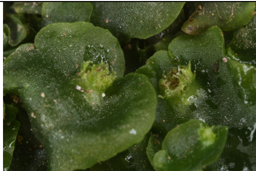
Abb. 17: Calycularia crispula