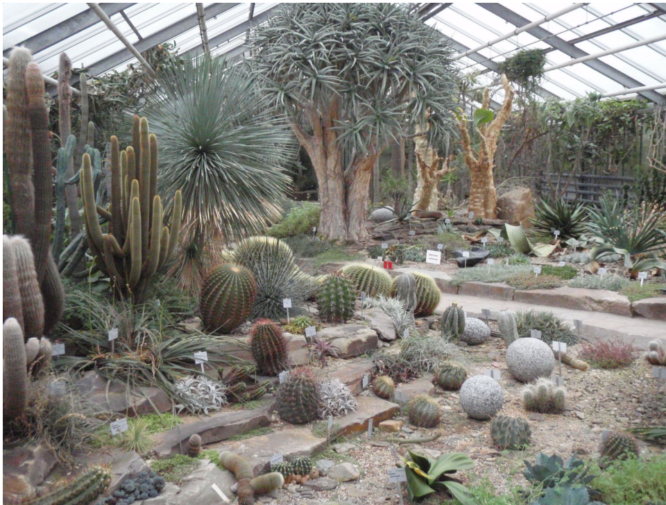
Abb. 21: Sukkulentenhaut