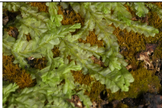
Abb. 4: Lophocolea semiteres