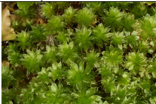
Abb. 24: Bryum sp.