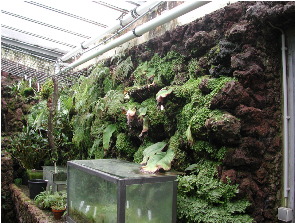
Abb. 6: Lavawand im Mooshaus