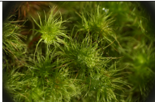
Abb. 7: Campylopus capitatus