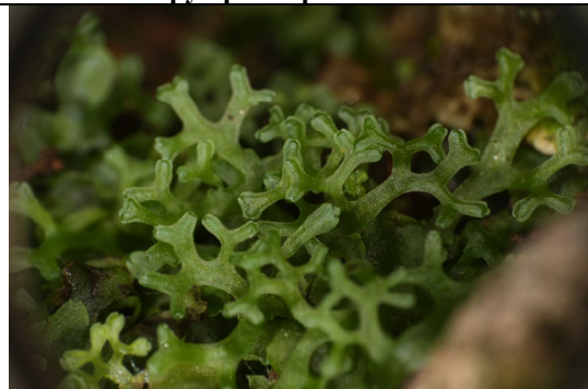
Abb. 9: Pellia endiviifolia