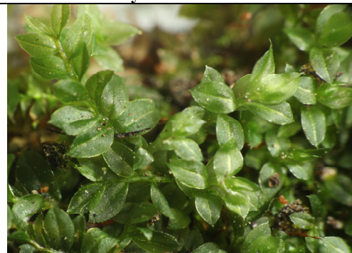
Abb. 25: Mnium sp.