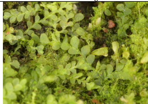
Abb. 20: Lejeunea laetevirens