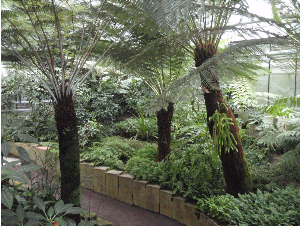
Abb. 1: Farnhaus