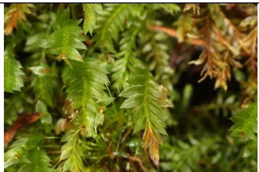
Abb. 5: Leptotheca gaudichaudii