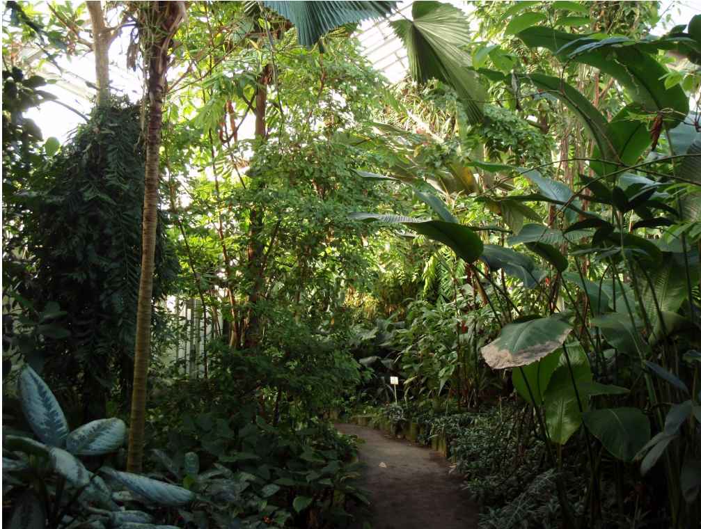
Abb. 16: Palmhaus