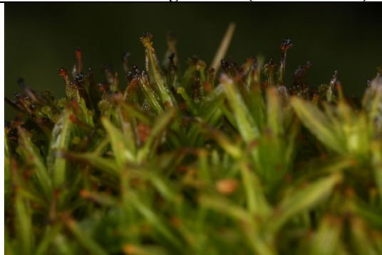
Abb. 12: Calymperes pallidum