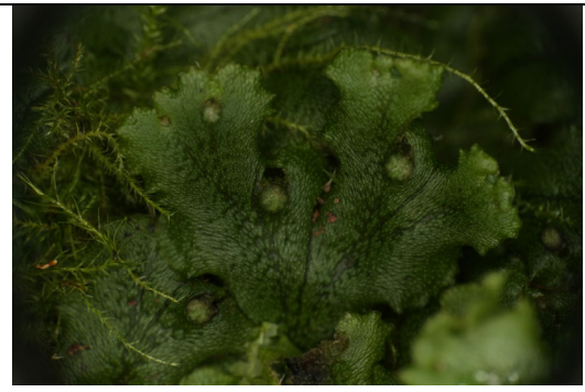
Abb. 8: Marchantia planiloba