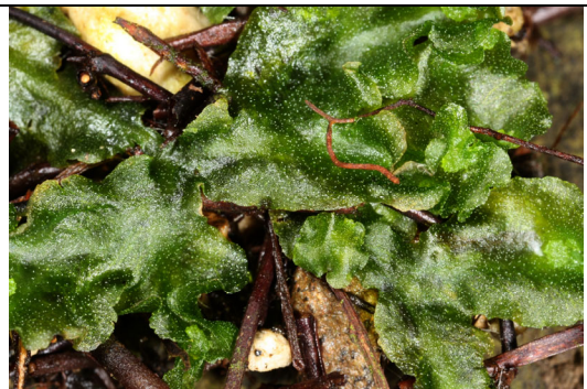
Abb. 3: Monoselenium tenerum