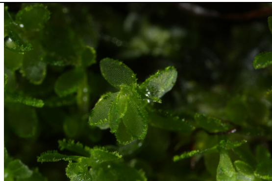
Abb. 2: Achrophyllum dentatum