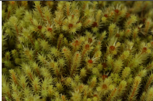
Abb. 14: Phlontis hastata