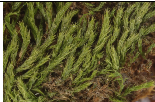
Abb. 23: Brachymenium acuminatum