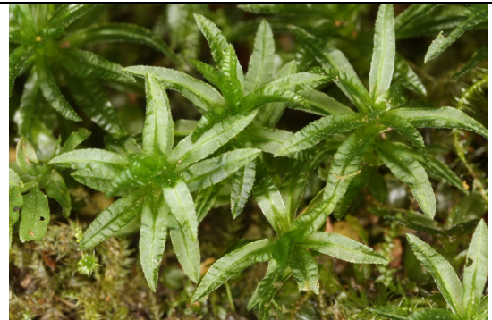
Abb. 13: Atrichum androgynum