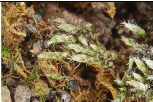
Abb. 22: Bryum arachnoideum