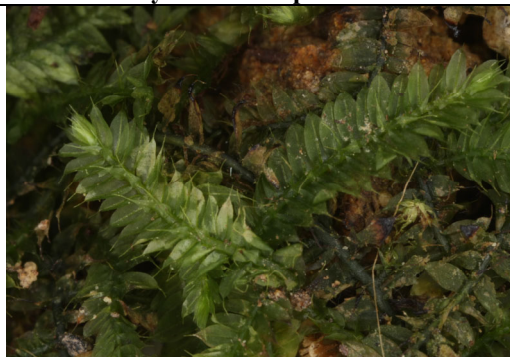
Abb. 19: Racopilum sp.