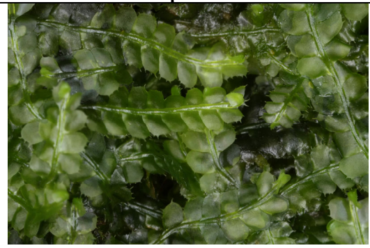
Abb. 10: Chiloscyphus triacanthus