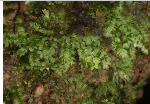
Abb. 18: Vesicularia montagnei