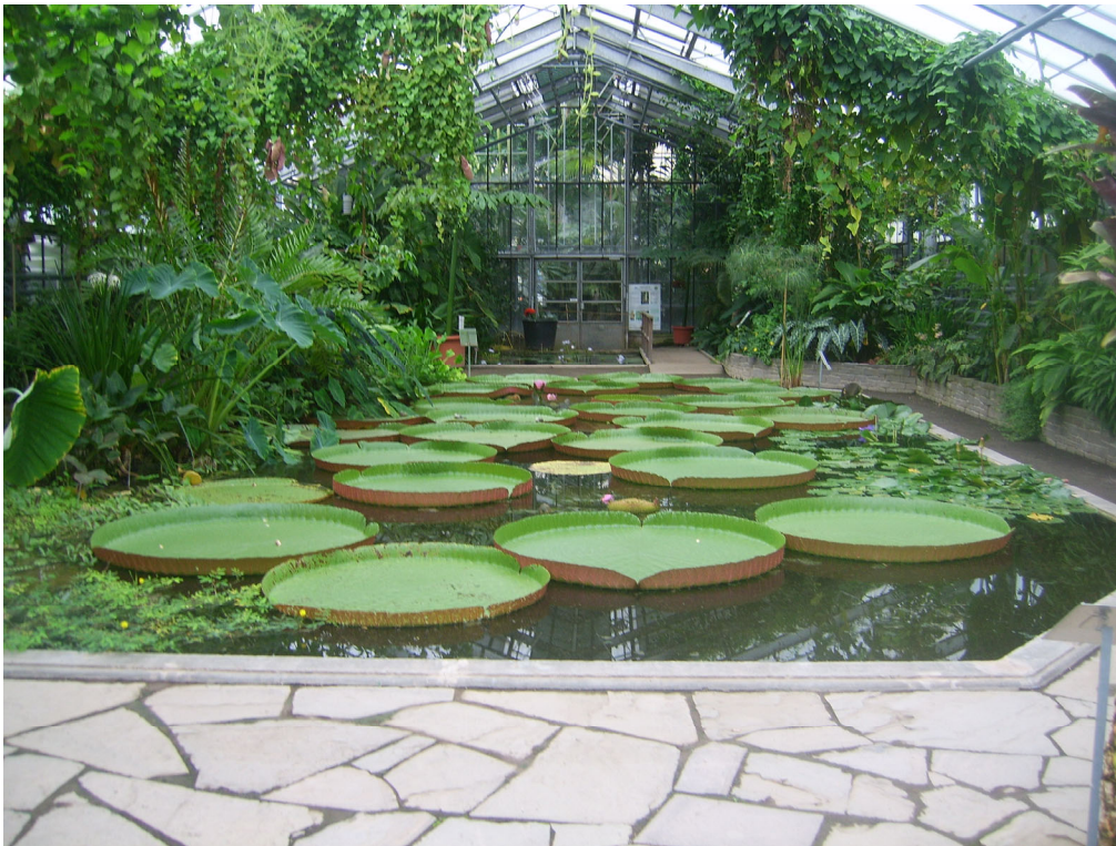
Abb. 11: Victoria-regia-Haus