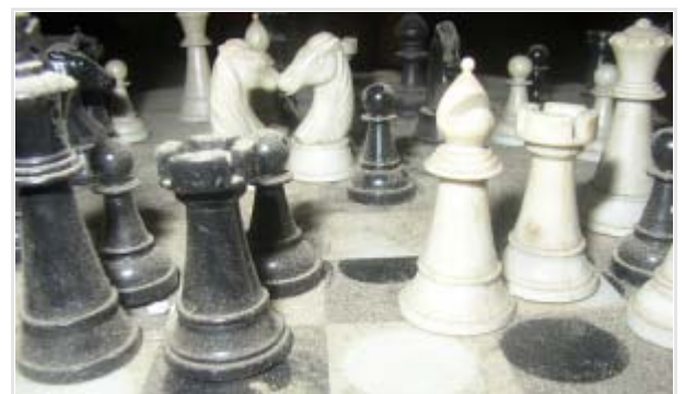
Chess for ever | Photo by magicArtwork (CC BY-NC-ND 2.0) via flickr

Bei PAX sims bin ich auf den Verweis auf den Artikel „ War Games “ im aktuellen Economist gestoßen, der beschreibt, wie US Geheimdienste Spiele und Simulationen benutzen, um Szenarien zu internationalen Krisen zu entwickeln. Der Artikel ist im Economist nicht frei zugänglich, kann aber bei PAX sims nachgelesen werden. Wer mehr erfahren möchte, klickt sich am besten durch den Blog von PAX sims , der sich um genau solche Simulationen und Spiele dreht.