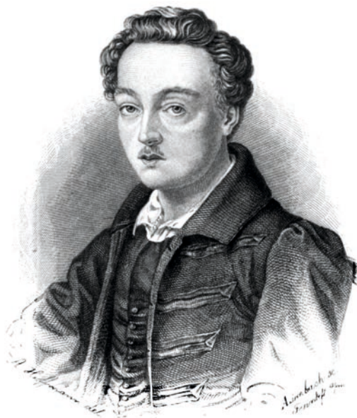
Georg Büchner nach einer Illustration einer französischen Werkausgabe von 1879.

Kurz bevor er nach Frankreich ins Exil geht, um der drohenden Verhaftung in seiner hessischen Heimat zu entgehen, schließt Georg Büchner im Februar 1835 die Arbeit an seinem Drama Danton's Tod ab.