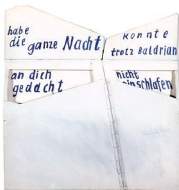
An Heinrich Heine, Holzbrief, 86 x 84 x 7 cm, verso, 1973. Sammlung Wilhelm-Hack-Museum, Ludwigshafen