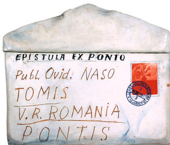
An Ovid (epistula ex ponto), Holzbrief 54 x 76 x 12 cm, Vorderseite, 1981. Sammlung Herzog August Bibliothek, Wolfenbüttel

Zahlreiche Exilschriftstellerinnen und -schriftsteller setzen sich in ihren Texten jedoch nicht nur mit exilierten Zeitgenossen auseinander, sondern wenden sich verstärkt auch Vertretern früherer Exile zu und suchen diese in Beziehung zu ihrer eigenen Exilsituation zu setzen. Dabei zeigen sie unter anderem ein großes Interesse an klassischen Exiltexten der Weltliteratur. Lion Feuchtwanger etwa beginnt seinen bekannten Vortrag Arbeitsprobleme des Schriftstellers im Exil (1943) mit der Betrachtung von Werken Ovids, Li-Tai-Pos, Dantes, Heinrich Heines und Victor Hugos und stellt, auch in Bezug auf sein eigenes Leben und Schreiben im Exil, fest: „Das Exil ist kein zufälliger Nebenumstand, es ist die Quelle dieser Werke. Nicht die Stoffe dieser Dichter haben sich verändert durch die Verbannung,