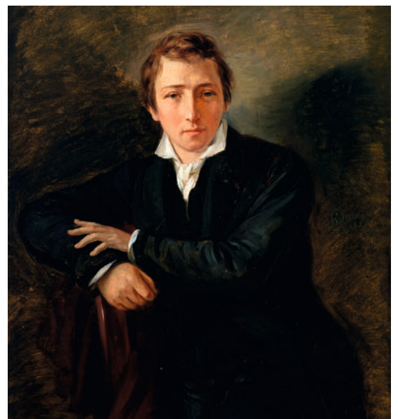
Heinrich Heine Gemälde von Moritz Daniel Oppenheim, 1831

Das Exil 1933-1945 ist von Beginn an eine Hochphase der Heine-Rezeption. Als Beleg dafür kann zunächst das Kulturleben im Exil angeführt werden. Seine Texte wurden sehr häufig sowohl in der Exilpresse gedruckt als auch in Briefen und autobiografischen Dokumenten zitiert, meist einhergehend mit Kommentaren, die Heine eine große Aktualität bescheinigen oder Heine als „Prophet“ der aktuellen Umstände lesen. 2 Es hat eine Reihe von