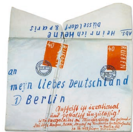
An Heinrich Heine, Holzbrief, 86 x 84 x 7 cm, recto, 1973. Sammlung Wilhelm-Hack-Museum, Ludwigshafen