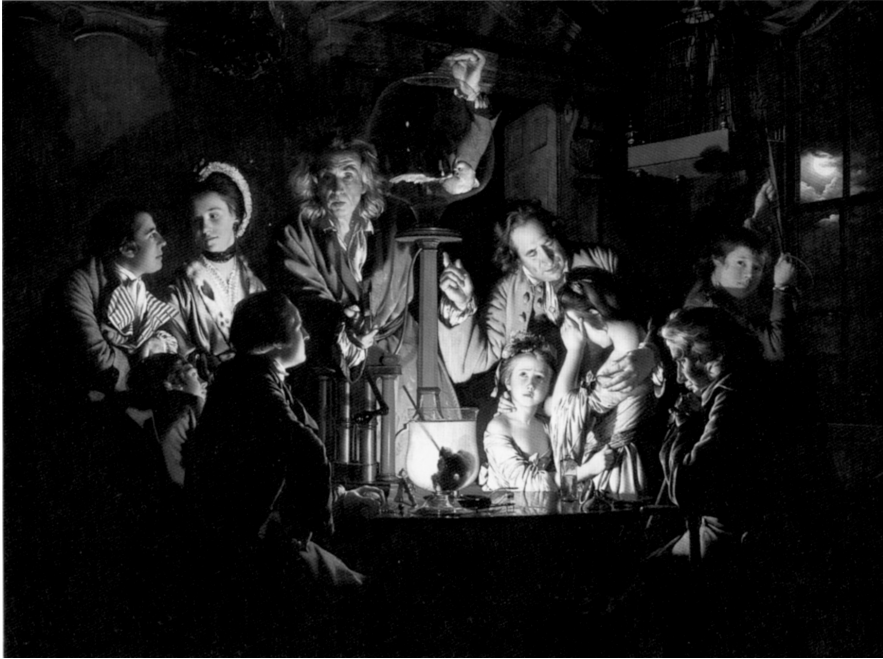
Abb. 42: Joseph Wright of Derby, Das Experiment mit der Luftpumpe, 1768, London, National Gallery

Assistenzfiguren zeigen verschiedene Blickbeziehungen und Reaktionen auf das Experiment. Die auffälligste, weil hellste Figuration wird von zwei Mädchen und einem Mann mittleren Alters gebildet. Das ältere Mädchen hat den Kopf gesenkt und die Hand vor die Augen gelegt, um den angeblichen Tod des Vogels nicht ansehen zu müssen. Die Jüngere jedoch blickt nach oben, während der Mann, augenscheinlich ihr Vater, den Arm um die ältere legt und nach oben auf den Glaskolben zeigt. Rechts von dieser Gruppe sitzt ein auf einen Stock gestützter grauhaariger Mann, der entweder auf den auf dem Tisch stehenden Glasbehälter schaut, in dem in einer Flüssigkeit eine Vogellunge schwimmt, oder auf die hinter diesem stehende brennende Kerze. Zwei der vier Figuren auf der linken Seite blicken auf den Glaskolben, die junge Frau scheint ihrerseits die Reaktion des neben ihr Stehenden zu beobachten, während der grünekleidete Mann wiederum auf die nach oben weisende Hand des Vaters zu blicken scheint. Die mittlere Achse des Bildes führt von unten nach oben gesehen durch die Lunge im Glas, die verdeckte Kerze, von der nur der Halter sichtbar wird, die weisende Hand, die rechte Lunge des Haubenkakadu im Glaskolben und die das Ventil öffnende Hand des Experimentators. Nach oben verlängert dürfte die Achsenlinie durch die außerhalb des Bildes liegende Spitze des Giebels führen, der auf Konsolen aufliegend eine hohe, geöffnete Tür bekrönt. Der Vollmond, der durch das Fenster mit seinem offenen