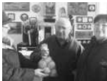
Bikur Cholim zum „Mizwa Day“