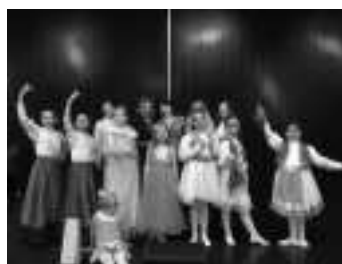
Aufführung der „Schneekönigin“