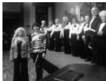
„Nordlicht“ mit beim „Abend der Chöre“