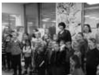
Workshop „Ich in der Welt“