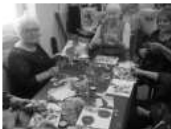
Kurs „Kreatives Gestalten“

Während der Kulturtage Mettenhof trat unser Chor „Nordlicht“ beim „Abend der Chöre“ auf.