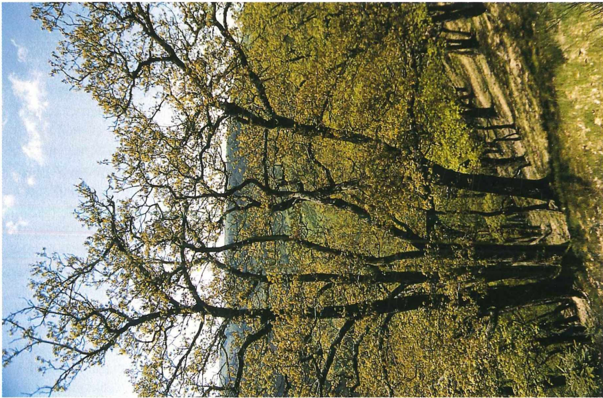
Bild 3: Bodensaurer Hainsimsen-Traubeneichenwald am Südhang mit sehr schütterer Krautschicht.