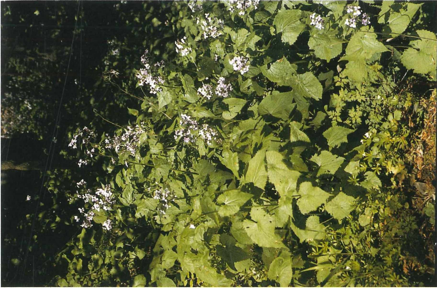
Bild 4: Im Schatthangwald der unteren Nordhänge wächst eine üppige Krautschicht, hier mit Linnaria rediviva .