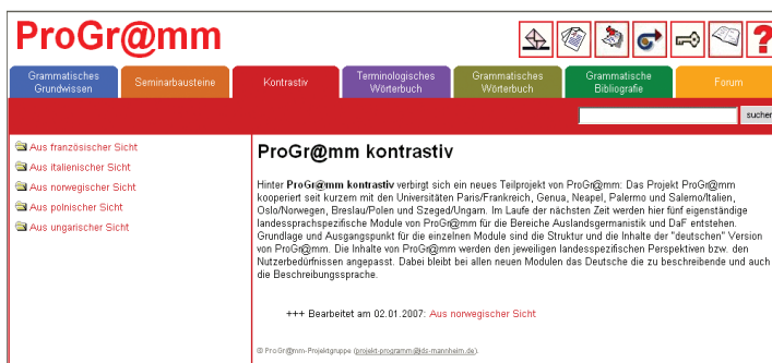
Abb. 1: ProGr@mm kontrastiv

Im März 2005 fand am Rande der Jahrestagung des IDS nach informellen Vorgesprächen ein erstes offizielles Treffen an gemeinsamer kontrastiver Grammatikarbeit interessierter europäischer Wissenschaftler statt. Die IDS-Projektgruppe ProGr@mm, die schon damals an der Didaktisierung grammatischer Inhalte aus der „Grammatik der deutschen Sprache“ 1 und aus dem darauf aufbauenden Hypertextsystem grammis 2 arbeitete und die sich entwickelnde Internetgrammatik um den kontrastiven Aspekt erweitern wollte, hatte zu diesem konstitutiven Treffen eingeladen. Die grammatischen ProGr@mm-Inhalte und deren multimediale Präsentation, die schon seit Sommer 2002 sukzessive auf der Internetplattform ProGr@mm 3 veröffentlicht wurden, sollten Grundlage und Ausgangspunkt für die gemeinsame Forschung sein. Es bot sich an, die Internetplattform auch als Publikationsort für eine neue kontrastive Arbeit zu nutzen: Für die kontrastive Darstellung der Grammatik des Deutschen wurde eine neue Hauptkomponente „ProGr@mm kontrastiv“ in die Lehr- und