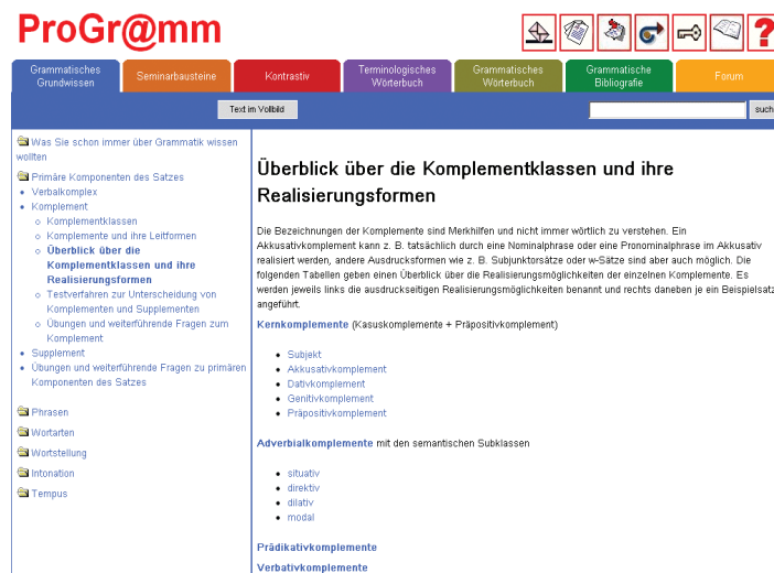
Abb. 1: Die Komplementklassen in ProGr@mm

Im Jahr 2004 begann eine neue Forschungsphase, die den kontrastiven Aspekt mit einbezieht. 6 Ziel des Projekts ist es, die grundlegenden Inhalte der Grammatik auf Deutsch zu beschreiben und gleichzeitig eine kontrastive Analyse im Hinblick auf einige größere europäische Sprachen (Französisch, Italienisch 7 , Ungarisch, Polnisch und Norwegisch) durchzuführen.