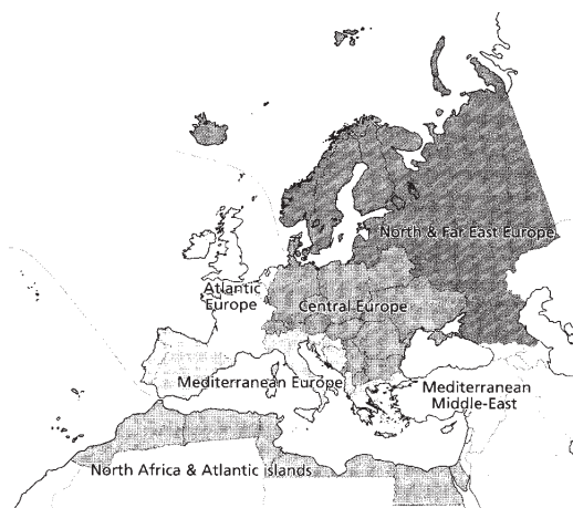
Abb./Fig. 1: 'Figure 1 – study area' (CANARD 2005: p.2)

Die Revue Arachnologique hat in einem gesondert paginierten und umfangreichen Heft diesen Katalog und damit einen wichtigen Beitrag zur Zoogeographie der europäischen und nordafrikanischen Spinnenfauna herausgebracht. Der erste Teil des Werks (8 Seiten) umfasst eine Einleitung und das Schrifttum, der zweite Teil (247 Seiten) ist der eigentliche Katalog. Der Autor hat neben Europa auch das gesamte mediterrane Gebiet und den Kaukasus katalogisiert. Die Verbreitung wird relativ grob in sechs zoogeographische Provinzen eingeteilt (Abb. 1): (1) Nord- und Osteuropa mit Island, Dänemark, Skandinavien, den baltischen Staaten und dem europäischen Teil der russischen Föderation, (2) Zentraleuropa von Deutschland und der Schweiz ostwärts bis Weißrussland (Belarus) und zur Ukraine, südöstlich bis Serbien-Montenegro, Mazedonien und Bulgarien, (3) Atlantisches Europa mit den Britischen Inseln, den Benelux-Staaten und Frankreich, (4) Mediterranes Europa mit der Iberischen Halbinsel, den Balearen, Korsika, Italien inklusive Sardinien und Sizilien, den Ländern entlang der adriatischen Küste und