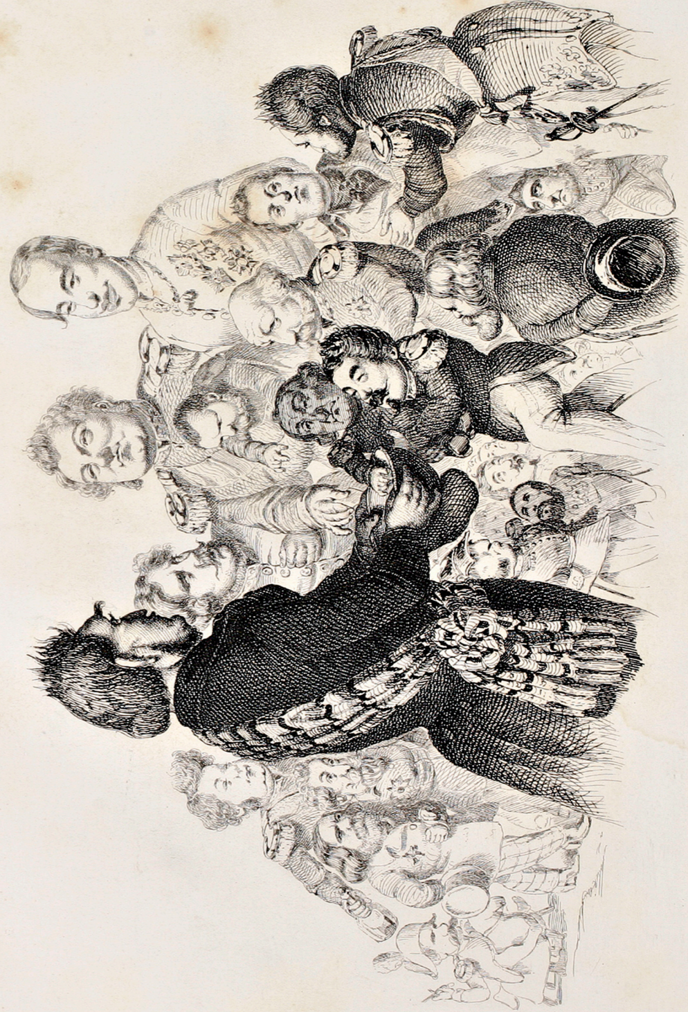
„Der deutsche Kaiser wird durch's Loos bestimmt, welches unter sämtlichen Fürsten Deutschlands Landes entscheidet.“