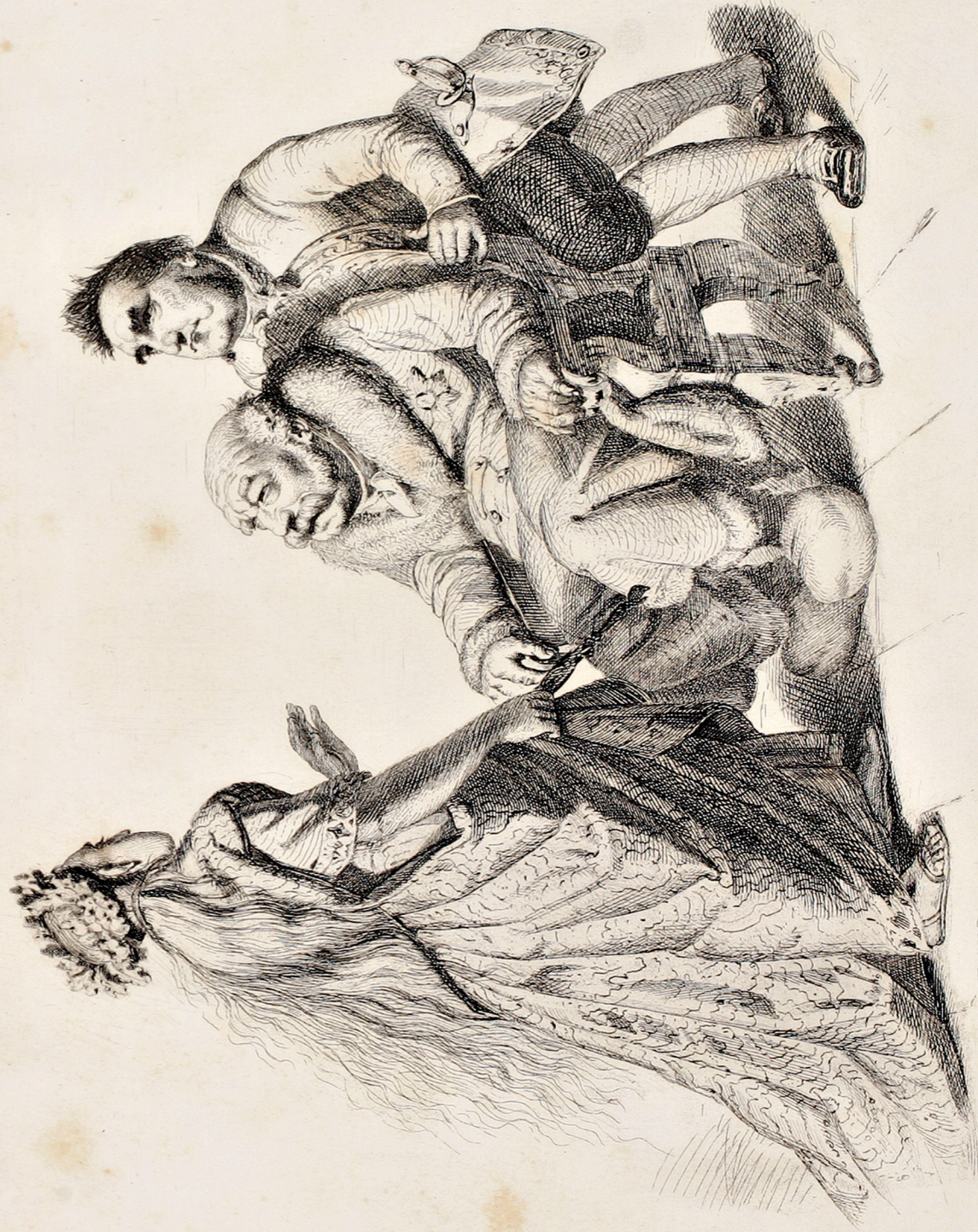
Die Kaiserin wird immer dem ältesten deutschen Fürsten übertragen (Wähltag des Abgeordneten K.K.)