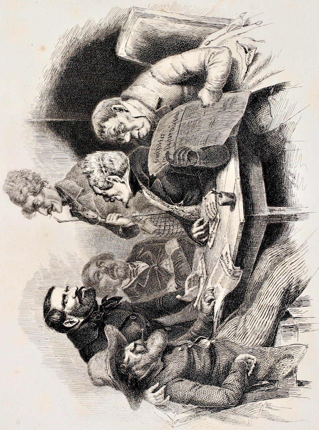
Die politischen Parteien nach dem Charakter der Partei