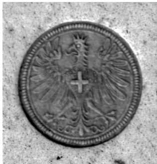
Abb. 1: Supralibros „Frankfurter Adler“ aus: N.libr.Ff. 10484

Nicht mitgezählt wurden solche Bände, welche einzig Besitzkennzeichen einer der Vorgängerbibliotheken der Frankfurter Universitätsbibliothek tragen. 8 Hier sind z.B. rund 160 Frankfurter Drucke zu nennen, welche – meist in Leder gebunden und in Blindprägung verziert – den Frankfurter Adler als Supralibros tragen. Bei der Sichtung der Sammlung fiel auf, dass alle Bände mit diesem Supralibros ausnahmslos aus dem Zeitraum 1578 bis 1662 stammen. Der Schwerpunkt liegt auf den beiden Dekaden vor und nach 1600, aus der Zeit vor 1600 stammen 44 Titel. Zu bemerken ist außerdem, dass keiner der Bände mit dem Frankfurter Adler irgendwelche Vorbesitzervermerke trägt. Es scheint so, dass das Supralibros nur bei Werken verwendet wurde, welche druckfrisch und ohne Einband in den Besitz des Rates kamen und auf dessen Kosten gebunden wurden.