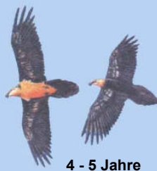
4 - 5 Jahre helle Kopffärbung