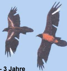
2 - 3 Jahre Markierungsreste u. Lücken