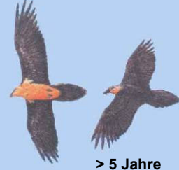
> 5 Jahre Kopf gelblich/rötlich

Die Wiederansiedlung des Bartgeiers wird aus dem EU-Förderprogramm Ländliche Entwicklung der Maßnahme Nationalpark gefördert.