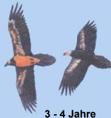
3 - 4 Jahre Kopf noch dunkel