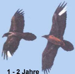
1 - 2 Jahre Markierungen deutlich

Grafiken: El Quebrantahuesos en los Pireneos (R. Heredia y B. Heredia); Ministerio de Agricultura Pesca y Alimentación. Publicaciones del Instituto Nacional para la Conservación de la Naturaleza, 1991