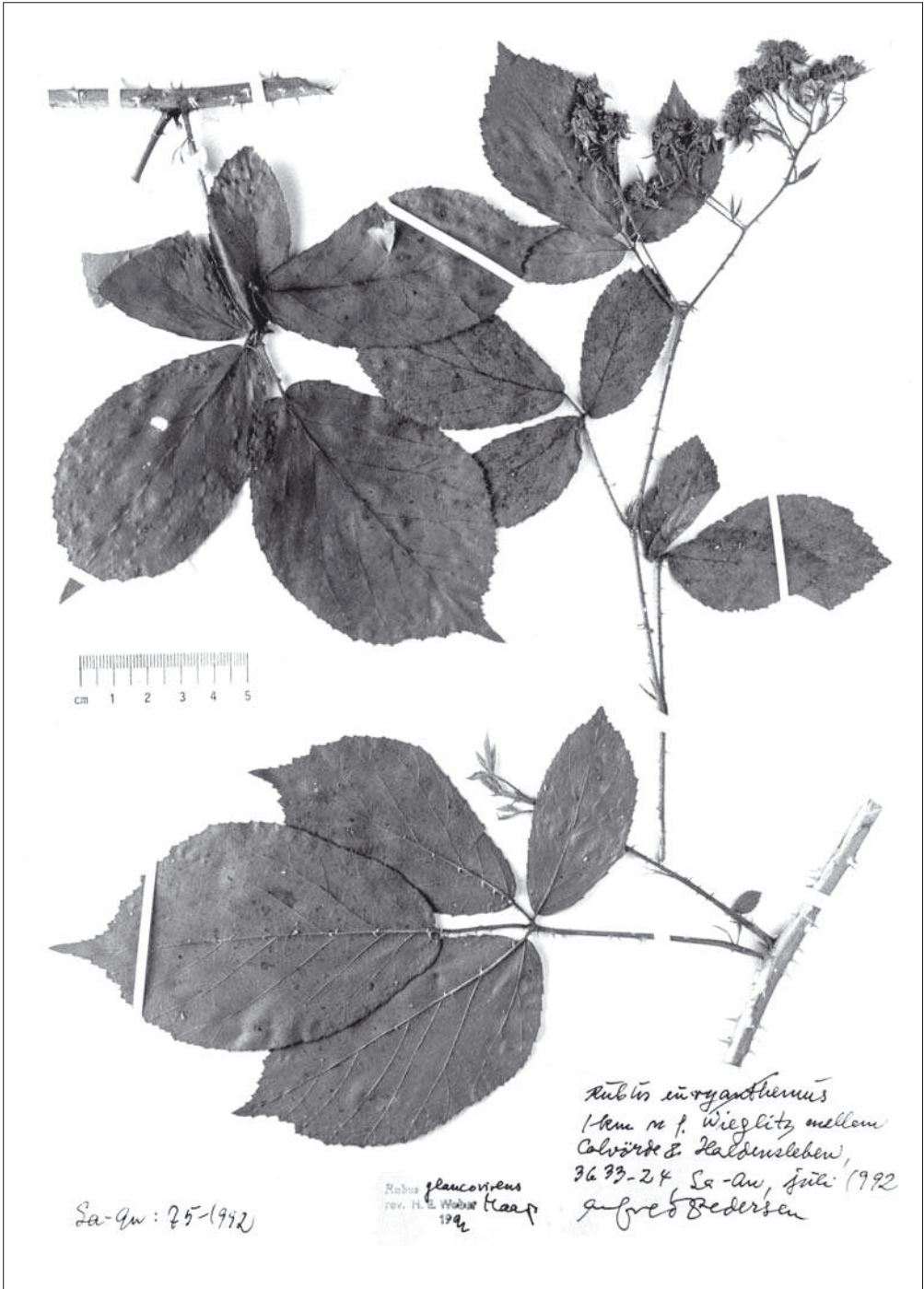
Abb. 1: Rubus glaucovirens MAASS. – Specimen normale (We).