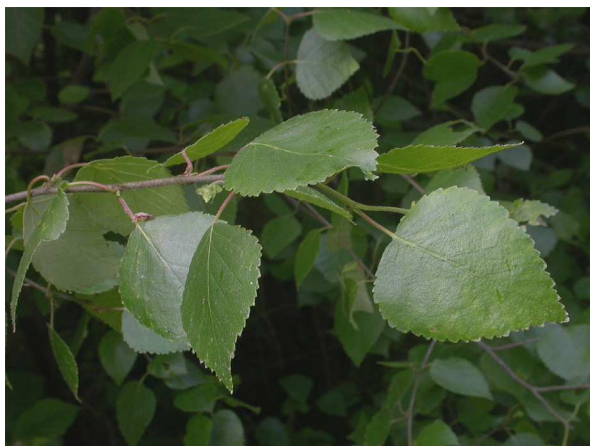
Abb. 3: Betula pubescens s. str. ist im Aachener Raum sehr selten. Betula pubescens s. str. is rare in the region of Aachen. Aachener Wald, Aachen/NRW (07.06.2006,).