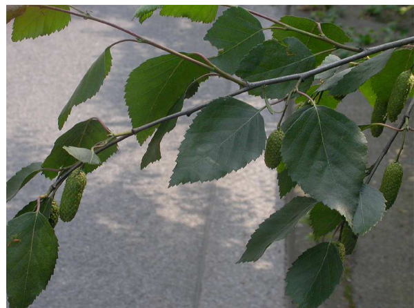
Abb. 4: Die im Aachener Raum recht häufige Betula ×aurata ähnelt von der Blattform her B. pubescens s. str. Betula ×aurata, which is quite frequent in the region of Aachen, resembles B. pubescens s. str. in leaf shape. Bleiberger Straße, Aachen/NRW (14.06.2006,).