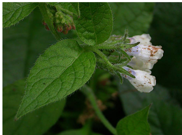
Abb. 8: Symphytum ×hidcotense, Tevereener Heide, Kreis Heinsberg/NRW (21.05.2006,).