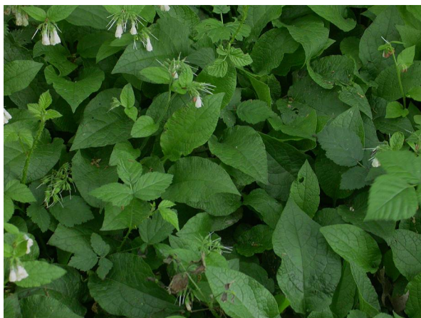
Abb. 7: Symphytum ×hidcotense, Tevereener Heide, Kreis Heinsberg/NRW (21.05.2006,).