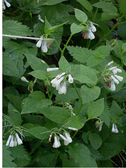
Abb. 9 & 10: Symphytum \times hidcotense, Aachen-Laurensberg/NRW (02.05.2009,).