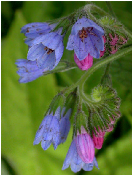
Abb. 5: Blüten von Symphytum caucasicum, bei Steckenborn, Städteregion Aachen/NRW (27.05.2009,).