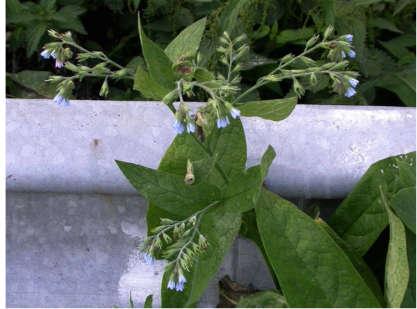
Abb. 2: Symphytum caucasicum, Aachen-Eilendorf/NRW (04.09.2008,).