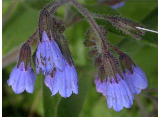
Abb. 4: Blüten von Symphytum caucasicum, bei Steckenborn, Städteregion Aachen/NRW (27.05.2009,).