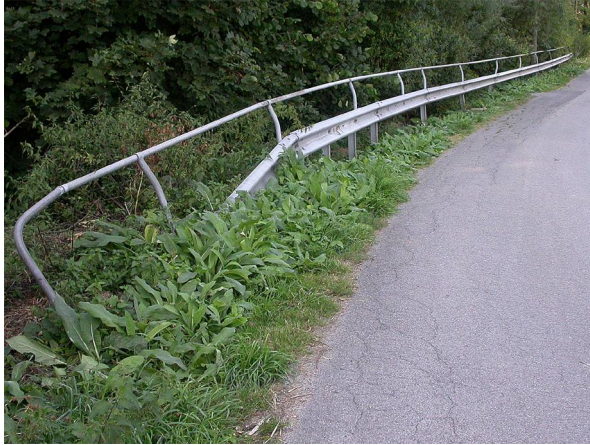
Abb. 1: Flächiger Bestand von Symphytum caucasicum an einem Straßenrand in Aachen-Eilendorf/NRW (04.09.2012,).