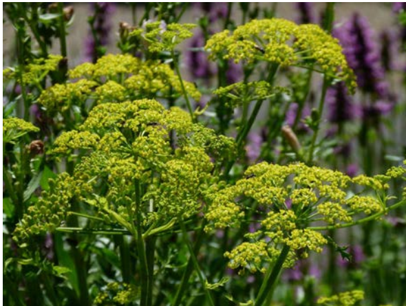
Abb. 1: Gemüse-Pastinak ( Pastinaca sativa ), Blütenstände (H. STEINECKE).

Der Verein zur Erhaltung der Nutzpflanzenvielfalt (VEN) bemüht sich um die Erhaltung von Arten und Sorten, die als Kulturpflanzen in Vergessenheit geraten oder zumindest zurückgegangen sind. Dazu gehört auch der Pastinak, im Femininum auch als Pastinake bezeichnet, mit wissenschaftlichem Namen Pastinaca sativa . Diese Art wurde im vergangenen Jahr vom VEN zur Gemüsepflanze der Jahre 2011 und 2012 ernannt. Doch damit ergeben sich sofort zwei Probleme: Wenn auch im Anbau seit Jahrzehnten vielerorts nicht mehr anzutreffen, erlebt sie doch in der Küche schon seit einigen Jahren eine erhebliche Renaissance, wie zahlreiche einschlägige Bücher zu Anbau und Zubereitung (u. a.) von Pastinak beweisen, von denen einige den Namen der Pflanze schon im Titel tragen: "Topinambur, Pastinak, Mangold und Co." (SOMMER & MÖLLER-SCHLÖMANN 2000), "Pastinaken & Co: von fast vergessenen und längst bekannten Gemüsesorten" (TSCHIRNER & ENDRESS 2008), "Vergessene Gemüse: Feine Rezepte für Pastinake, Portulak und mehr" (REDDEN 2011) und einige weitere. Seitdem wird diese Art zumindest vereinzelt mehrfach angebaut und gehört gewiss nicht (mehr) zu den bedrohten Nutzpflanzen in vorderster Reihe, von alten hier zugehörigen Sorten einmal abgesehen. Hinzu kommt allerdings, dass der Pastinak zumindest regional gar keine alte Kulturpflanze zu sein scheint, sondern überhaupt erst in jüngerer Zeit angebaut wurde.