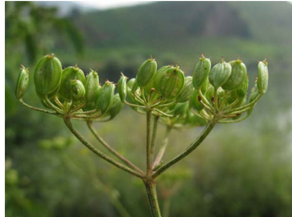
Abb. 16: Glanzloser Pastinak ( Pastinaca umbrosa ), Fruchtstand (Moseltal, A. JAGEL).

Diese Merkmale charakterisieren den Glanzlosen Pastinak deutlich und grenzen ihn bei gemeinsamem Vorkommen mit anderen Sippen nach eigenen Beobachtungen stets eindeutig ab (zu Fruchtmerkmalen vgl. zudem FISCHER & al. 2008). Die Merkmalsstabilität in Kombination mit eigenständiger Aufblühphänologie ergibt eine hinreichende Berechtigung, P. umbrosa als Art anzuerkennen. Verwischende Merkmalsgrenzen durch Hybridisierung werden allerdings angegeben: HESS & al. (1970) erwähnen ein häufigeres Auftreten von Übergängen zum Wiesen-Pastinak in der Schweiz (LANDOLT 2001 gibt jedoch für den Züricher Raum keine Hybriden an, dafür aber THELLUNG 1926 für den Raum Genf) und MEIEROTT (2008) betont, dass bei allen drei Vorkommen von P. umbrosa in seinem vornehmlich unterfränkischen Untersuchungsgebiet eine zunehmende "Aufbastardierung" durch den nachfolgend behandelten Wiesen-Pastinak zu beobachten sei. Andererseits wurden bei Untersuchungen von teils sehr großen gemeinsamen Vorkommen in Westfalen, im Trierer Raum und im Moseltal keine unmittelbaren Hinweise auf Hybridisierungen gefunden (in ähnlicher Weise vgl. GERSTBERGER 1995). Gelegentlich konnten im Ruhrgebiet weitgehend un- bzw. spärlicher behaarte Populationen von P. umbrosa nachgewiesen werden, die sonst (einschließlich der Aufblühzeit) keinerlei Hinweise auf eine Introgression durch den Wiesen-Pastinak gegeben haben.