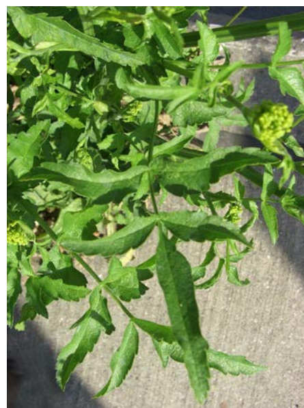
Abb. 10: Wiesen-Pastinak ( Pastinaca pratensis ), Stängelblatt, A40 in Bochum.