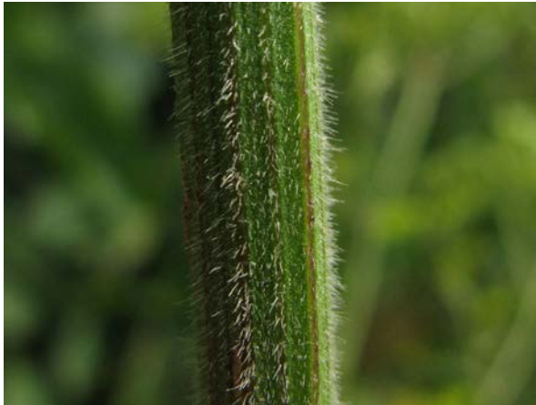
Abb. 15: Glanzloser Pastinak ( Pastinaca umbrosa ), Stängelbehaarung (Moseltal, 2009).