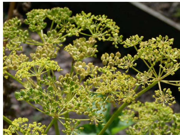
Abb. 20: Wiesen-Pastinak ( Pastinaca pratensis ), Fruchtstände (H. STEINECKE)