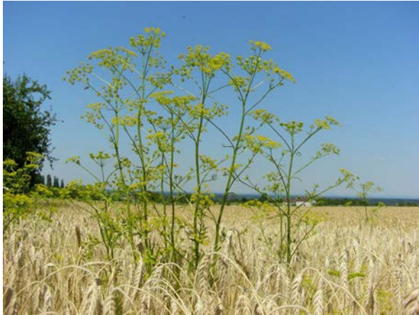
Abb. 17: Wiesen-Pastinak ( Pastinaca pratensis ) in einem Acker bei Geseke/Westfalen (A. JAGEL).