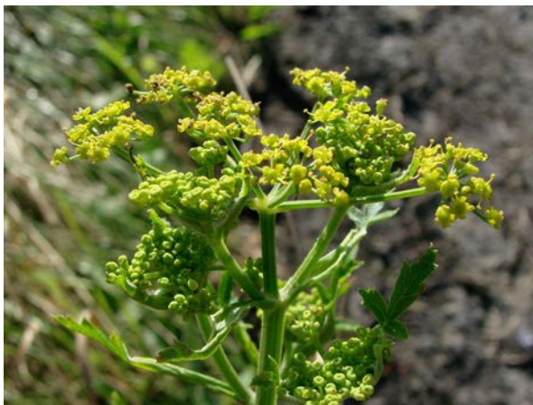
Abb. 19: Wiesen-Pastinak ( Pastinaca pratensis ), Blütenstand, A40 in Bochum (S. WOLF).