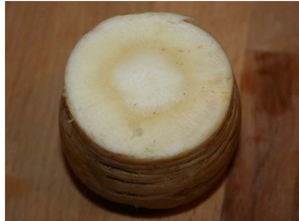
Abb. 4: Gemüse-Pastinak ( Pastinaca sativa ), Querschnitt einer Pastinakrübe (C. BUCH).

Die Blätter sind als grundständige Rosettenblätter und als Stängelblätter ausgebildet, weshalb der Pastinak als Halbrosettenpflanze zu bezeichnen ist. Die Blätter sind meist einfach, gelegentlich zweifach unpaarig bis ungleich gefiedert, mit drei bis acht Paaren (bei den grundständigen meist 7-8) ungleich gekerbter bis eingeschnittener, meist elliptischer bis lanzettlicher Fiedern, oberseits mehr oder minder glänzend sowie glatt und (scheinbar) unbehaart oder spärlich bis zerstreut, sehr selten stärker rauhaarig. Die Blattunterseite ist dagegen meist deutlicher (fühlbar) rauhaarig. Das Endblättchen ist häufig dreilappig ausgebildet. Die Blattstiele der Stängelblätter umfassen den Stängel mit breiter Basis. Nach oben hin am Stängel reduziert sich die Größe, Lappung und Fiederzahl der Blätter immer mehr, bis sie ganz oben zu sitzenden schmalen Brakteen reduziert sind.