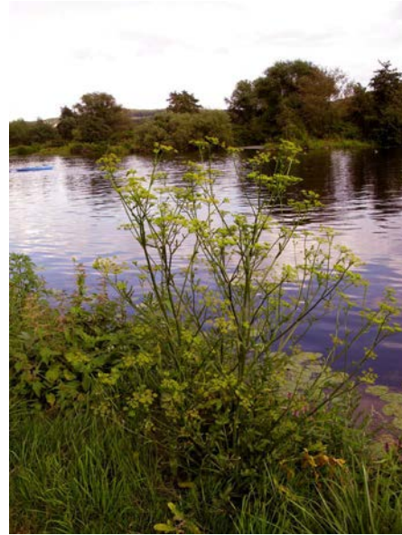
Abb. 18: Wiesen-Pastinak ( Pastinaca pratensis ), am Ruhrufer in Bochum (A. JAGEL).