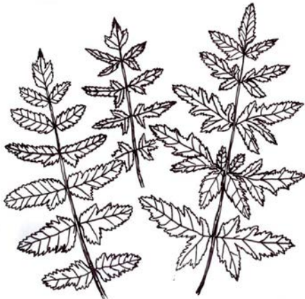
Abb. 7: Wiesen-Pastinak ( Pastinaca pratensis ), untere Stängelblätter (Zeichnungen: G. H. Loos)