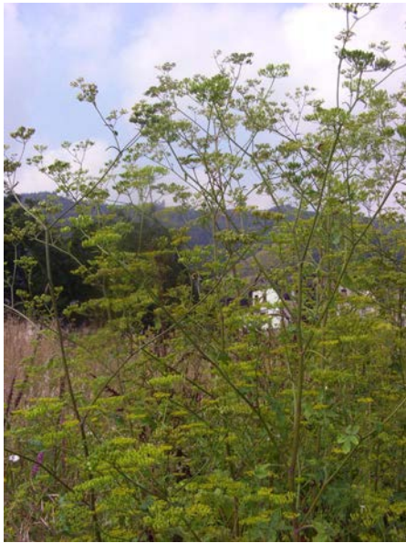
Abb. 13: Glanzloser Pastinak ( Pastinaca umbrosa ), Bestand im Moseltal.