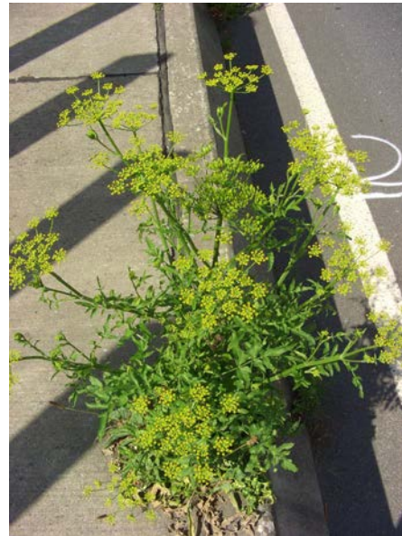
Abb. 2: Wiesen-Pastinak ( Pastinaca pratensis ) in einer Pflasterfuge auf dem Mittelstreifen der A40 in Bochum (T. KASIELKE).

Das zweite Problem betrifft die Identität des Pastinaks. Unter dem Namen Pastinaca sativa (im weiteren Sinne) werden traditionell alle in Mitteleuropa vorkommenden Sippen der Gattung zusammengefasst, wenn auch auf unterschiedlichem taxonomischen Niveau: So findet sich in der meisten bestimmungskritischen Literatur eine Gliederung in drei Unterarten, wobei die als Typus betrachtete Unterart nochmals in zwei Varietäten unterteilt wird. Wenn diese Gliederung akzeptiert wird, dann handelt es sich bei dem vom VEN gemeinten Taxon um die als Pastinaca sativa subsp. sativa var. sativa bezeichnete Sippe, jedenfalls die