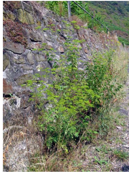
Abb. 14: Glanzloser Pastinak ( Pastinaca umbrosa ), Bestand im Moseltal am Calmont (A. JAGEL).