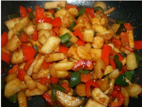
Abb. 21: Pfannenhilfzeit mit Pastinak und Paprika (C. BUCH).

wurde, aber zuvor zeitgleich mit ihm und in kaum geringerem Umfang kultiviert wurde, was die in Kap. 2 skizzierte Namensverwechslung und -zusammenfassung belegt. Da Pastinak eine anspruchslose Pflanze ist, die auf nährstoffarmen, tiefgründigen Moorböden gut gedeiht, waren die potenziellen Anbauggebiete zumindest in Norddeutschland groß (angeblich stammen daher Volksnamen wie "Morwortel" und daraus hochdeutsch "Moorwurzel" – dabei kann es sich aber um Namensvertauschungen mit der Möhre/Mohrrübe handeln). Andererseits zeigt zumindest der Wiesen-Pastinak eine ausgesprochene Präferenz für nährstoff- und basenreiche, meist kalkhaltige Böden, sodass Pastinaken in jedem Fall eine größere Anbaupotenz aufweisen als manches andere Wurzelgemüse und Viehfutter.