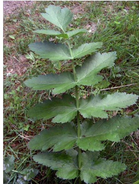
Abb. 8: Wiesen-Pastinak ( Pastinaca pratensis ), Grundblatt, in seiner Form ganz den Grundblättern von P. sativa entsprechend.