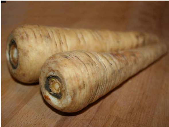
Abb. 3: Gemüse-Pastinak ( Pastinaca sativa ), Pastinakrüben (C. BUCH).

einjährigen Stadium gut entwickelt und bildet sich bei voll ausgewachsenen, blühenden Pflanzen stärker zurück, wird zumindest aber dann auch fester, faseriger und verliert ihre Fleischigkeit (vgl. WARNING 1934). Im Durchschnitt erreicht sie eine Länge von 25 cm und Breite von 6 cm, wobei die genauen Werte sortenabhängig sind und bei den Sorten mit langen, schlankeren Rüben extreme Werte in der Länge nach oben hin häufiger auftreten (HORNEBURG 2009 berichtet von Maximallängen bis mindestens 1,70 m). Die Rübe ist reich an Stärke und anderen Zuckern (11-18 g auf 100 g frischer Rüben) sowie an Kalium (342-740 mg auf 100 g frischer Rüben) bei geringem Wassergehalt (79-83%). An Vitaminen ist der Vitamin C-Gehalt, der im mittleren Bereich liegt (6-32 g), erwähnenswert (Angaben nach KÖRBER-GROHNE 1995).