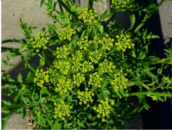
Abb. 11: Wiesen-Pastinak ( Pastinaca pratensis ), Blütenstand.