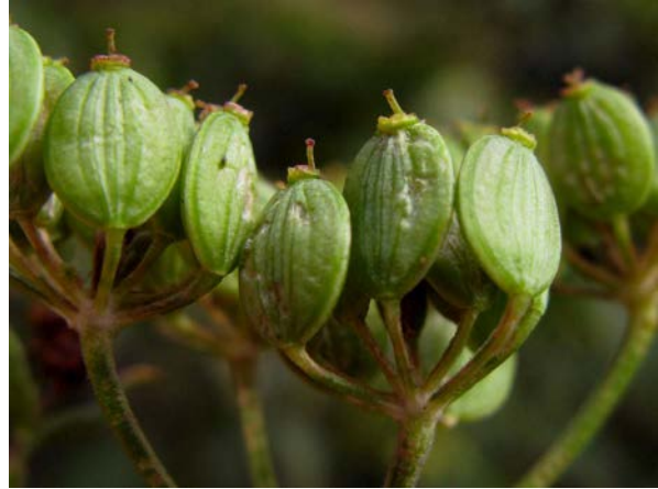
Abb. 12: Glanzloser Pastinak ( Pastinaca umbrosa ), unreife Früchte (A. JAGEL).