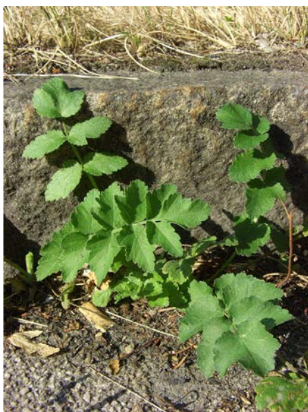
Abb. 9: Wiesen-Pastinak ( Pastinaca pratensis ), Grundblätter auf der A40 in Bochum (T. KASIELKE).