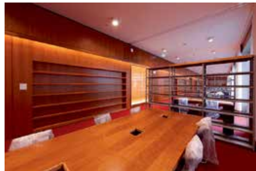
Studentische Arbeitsplätze im PEG-Gebäude

Alle Fragen, die in dieser Sonderausgabe nicht beantwortet werden, können über die universitäre Intranet-Website gestellt werden (s. Anhang).