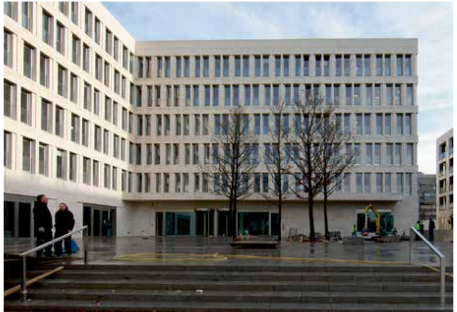
Eingang zum PEG-Gebäude

Institut. Mit der dann folgenden ersten Ausbaustufe wurden fünf Gebäude neu errichtet: Das House of Finance (HoF), das Gebäude der Rechtswissenschaft und Wirtschaftswissenschaften (RUW), das Hörsaalzentrum, der Anbau Casino sowie die Studierendenwohnheime der christlichen Kirchen mit dem Haus der Stille. Architektonisch eigenständig fügten sie sich dennoch harmonisch in die Parklandschaft und das bestehende Gebäudeensemble ein.