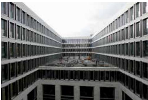
Innenhof des PEG-Gebäudes

Im Folgenden werden häufig gestellte Fragen beantwortet.