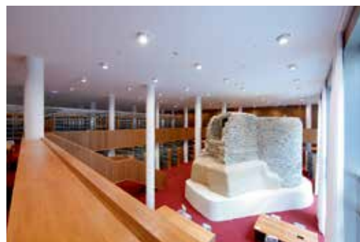
Ins PEG integriertes historisches Turmfragment

Wir bitten um Ihre konstruktive Mithilfe beim Umzug!