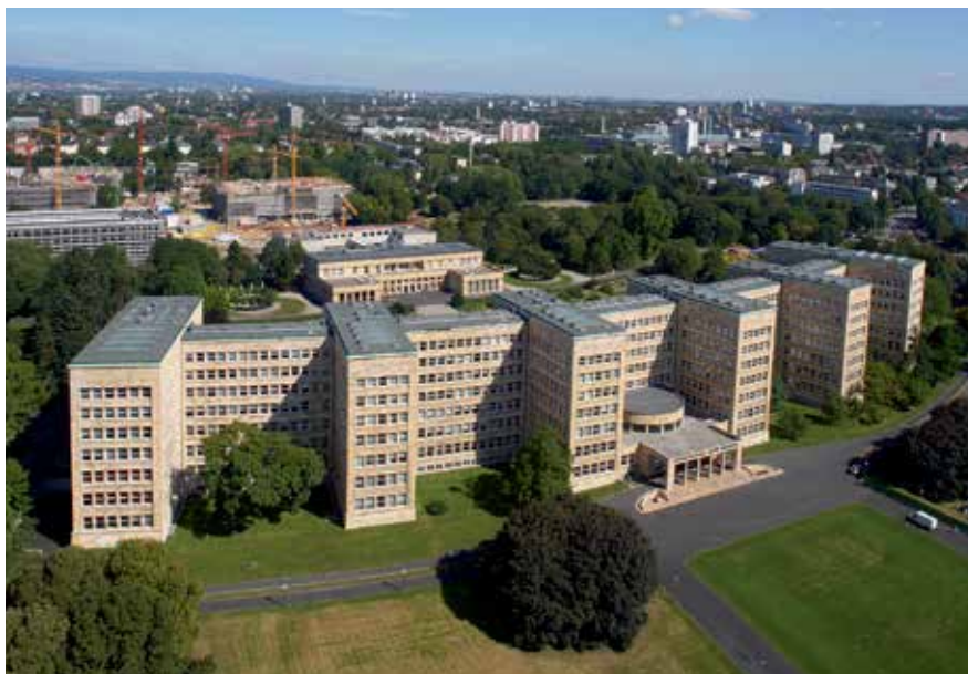
Campus Westend von Süden aus gesehen